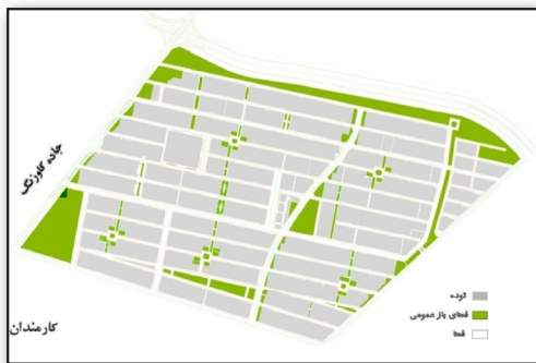
تصویر ۱. فضاهای باز و ساخته شده کوی کارمندان در یک تفکیک شطرنجی. Fig 1. Open and built spaces in Karmandan neighborhood in a grid pattern.