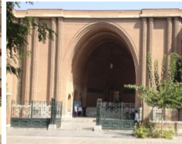
تصویر ۱. بزرگی، یگانگی، ریتم، تعادل، امتداد و تداوم بصری، افراستگی و سلطه بصری (تأثیر نظامی‌گری در ساخت معماری).