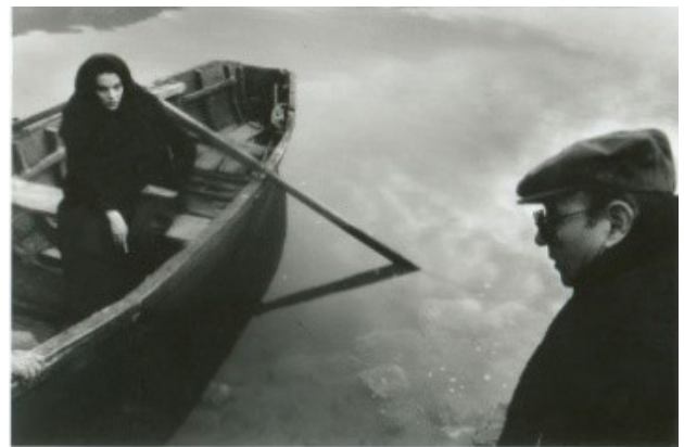
تصویر ۲. تئو آنجلوپولوس سر صحنه ساخت فیلم «نگاه خیره اولیس» (۱۹۹۵ م)

فیلم «نگاه خیره اولیس» اقتباسی آزاد از روایت ادیسه هومر است؛ روایت آنجلوپولوس شکل یک تاریخچه سینمایی را در طول ۱۰۰ سال جنگ بالکان و پیامدهایش