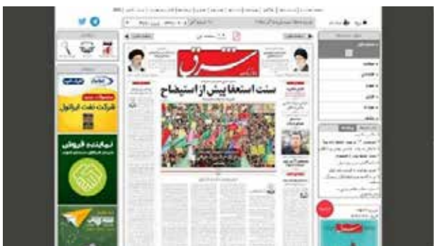
تصویر ۷. پایگاه وب شرق.