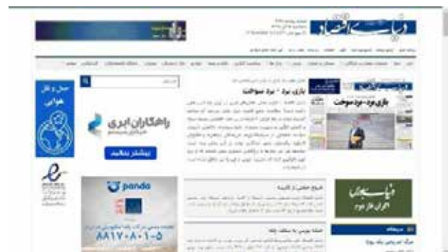
تصویر ۳. پایگاه وب دنیای اقتصاد.