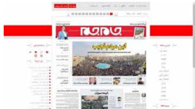
تصویر ۲. پایگاه وب جام جم.