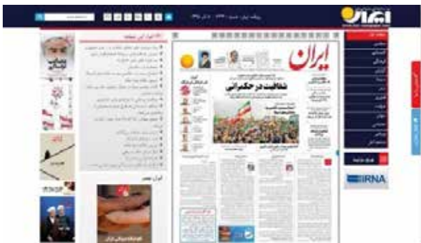
تصویر ۶. پایگاه وب ایران.