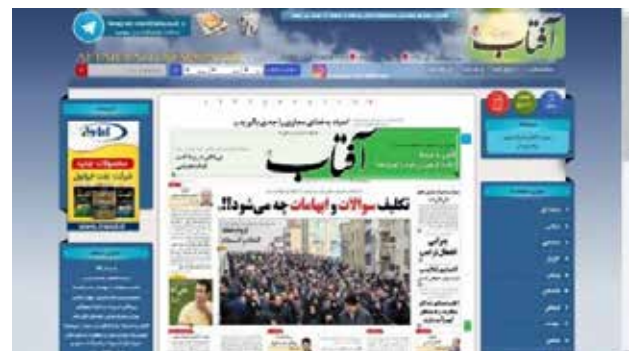
تصویر ۵. پایگاه وب آفتاب یزد.

کرده‌اند. علاوه بر این، داده‌ها روشن می‌سازد عوامل ساختاری در مقایسه با رنگ تأثیر بیشتری در ادراک زیبایی‌شناسی ذهنی دارند. عامل ساختاری وحدت تأثیر زیادی بر هر دو جنبه زیبایی‌شناسی کلاسیک و بیانگر از طریق تأثیرگذاری بر بُعد سادگی و ساخت دارد. فقط عامل وحدت است که بر همه ابعاد ادراک ذهنی زیبایی‌شناسی تأثیر می‌گذارد. عامل تنوع با تمامی ابعاد زیبایی‌شناسی ذهنی رابطه منفی دارد. عامل پویایی تنها با بُعد گوناگونی رابطه مثبت دارد. دستاوردهای عملی این مطالعه علاوه بر ایجاد درک بهتر