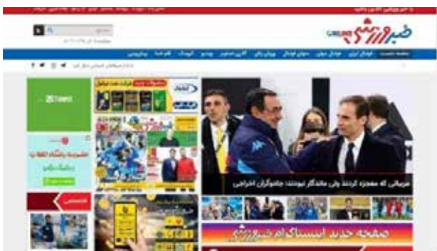
تصویر ۸. پایگاه وب خبرورزشی.