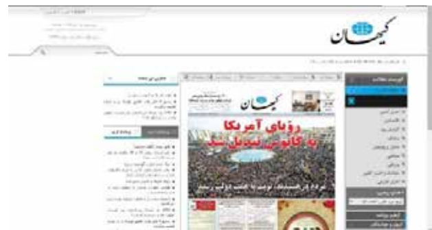
تصویر ۴. پایگاه وب کیهان.