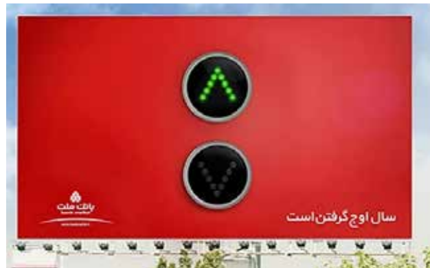
تصویر ۶. تبلیغ بانک ملت، دی ان ای یونیون، ۱۳۹۸.

بررسی جامعه آماری بیلبردهای ایرانی که در ایده‌پردازی آنها از استعاره بصری استفاده شده همانطور که انتظار می‌رفت قابل تطبیق با مکانیسم‌های ارائه شده توسط فنگ و او‌هالوران (Feng و O'Halloran) است. به جهت مطالعه مکانیسم‌هایی حاوی انواع مختلف بودند؛ حداقل یک مورد از هر نوع، مورد توجه واقع شد که نتایج حاصل از آن نشان می‌دهد که بیلبردهایی که در ایده‌پردازی از استعاره بصری بهره گرفته‌اند؛ قابل تطبیق با یکی از این مکانیسم‌ها است و در طراحی گرافیک می‌توان با اتکا به آنها به خلق استعاره بصری دست یافت. از تحلیل جامعه آماری مشتمل بر ۳۵