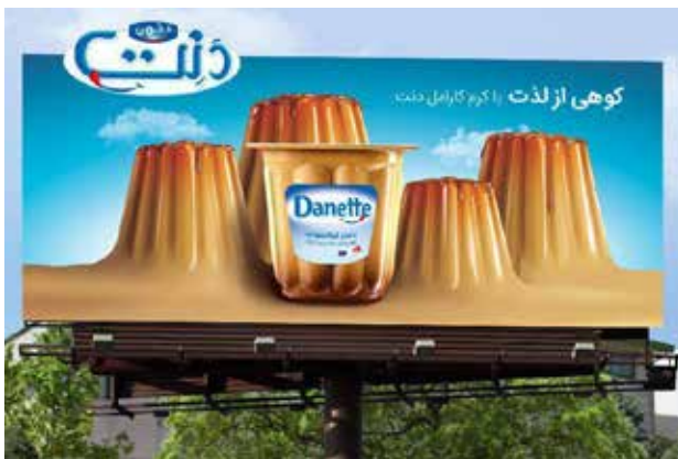
تصویر ۵. تبلیغ کرم کارامل دنت، ایران ادز، ۱۳۹۷.

این بیلبورد برای محصول لوله‌های پلیمری طراحی شده است (تصویر ۱-۷). مکانیسم بازنمایی بصری استعاره از نوع استعاره آشنایی‌زدایی بوده و در آن رابطه جزء-کل مشاهده می‌شود که از نوع تحلیلی است. این بیلبورد به مناسبت نوروز طراحی شده و با توجه به محتوای فرهنگی نوروز در کشورمان، طراح سبزه عید را به کار برده است. سبزه به عنوان ماهیت کل است که جزء متعارفی از آن (برگ‌های تازه جوانه زده) با جزء نامتعارف (لوله‌های سبز) جایگزین شده است. صفت بارز سبزه عید، جوانه‌زدن و رشد و آغاز زندگی دوباره است و در این استعاره این صفت به لوله نسبت داده شده است. قابل ذکر است که این لوله‌ها در مقایسه با لوله‌های فلزی مزایای بسیاری دارند که در صورت جایگزینی با لوله‌های فلزی سنتی تفاوت کاربردی چشمگیری خواهند داشت. اگر از این منظر به بیلبورد توجه کنیم می‌توان گفت که استعاره حاضر به لحاظ تبلیغات محصول چندان قوی و گویای صفات لوله سبز نیست اما باید توجه داشت که آنچه مورد توجه طراح بوده به یقین رویکرد زیباشناسی و محتوای فرهنگی به‌منظور تبریک سال