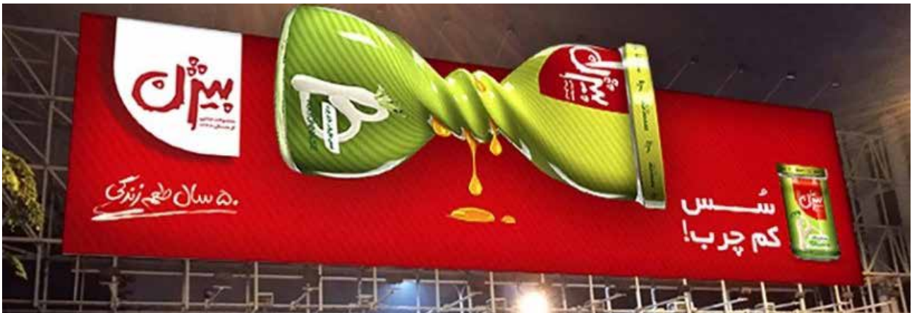
تصویر ۴. تبلیغ سس مایونز کم چرب بیژن، گروه تخصصی تبلیغات ماوی دیزاین، ۱۳۹۴.