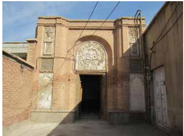
تصویر ۲. نمای رو به معبر شمالی خانه شربت‌اوغلی. عکس: سمیه جلالی میلانی، ۱۳۹۵.

حال باید دید که چه مباحثی می‌تواند تأمین‌کننده تجربه عملی لازم برای توصیف پیش‌آیکنوگرافیک نمای خانه شربت اوغلی باشد؛ معنای طبیعی این نما چگونه قابل دستیابی است و تاریخ سبک‌ها به چه نحو می‌تواند برای پیشگیری از بروز خطا در توصیف به کمک آید.