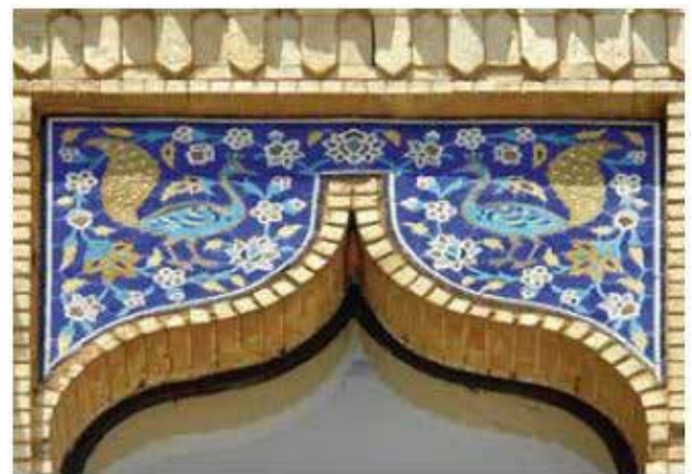
تصویر ۹. نقش‌مایه دو طاووس و درخت زندگی در بخشی از نمای خانه هنرمندان اصفهان که در اواخر دوره قاجار با کاربری مسکونی ساخته شده است. عکس: سمیه جلالی میلانی، ۱۳۹۵.

توصیف و تحلیل و فهم معنای جنبه‌های ساختاری نماهای خانه‌های تاریخی و بخش‌هایی که واجد ویژگی‌های فرمی و فضایی هستند، در کنار الحاقات واجد ویژگی‌های تصویری به کار برد. این در حالی است که مرتبه سوم صرفاً قابل‌کاربرد بر بخش‌های تصویری نماست که عموماً تحت عنوان تزئینات از آن یاد می‌شود.