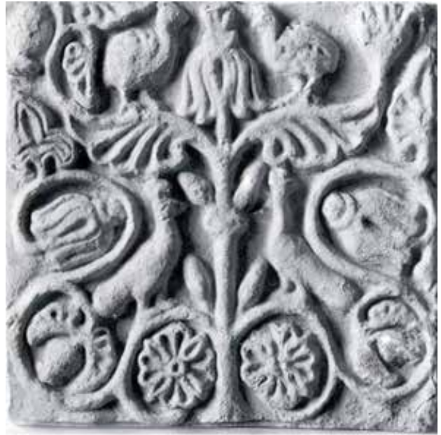
تصویر ۶. نقش مایه درخت زندگی و طاووس بر روی لوح گچی تیسفون، دوره ساسانیان. موزه متروپولیتن. مأخذ: مبینی و شافعی، ۱۳۹۴، ۵۴.

۱. بهره‌گیری از خوانش آیکونولوژیک در مطالعه نمای خانه‌های تاریخی این امکان را برای پژوهشگر فراهم می‌آورد که با نزدیک شدن به معانی نهفته در آن، از افکار خودآگاه و ناخودآگاهی که در ذهن معمار نما، سازنده آن، صاحبخانه و یا هر فرد دخیل دیگری وجود داشته و در شکل‌گیری نما مؤثر