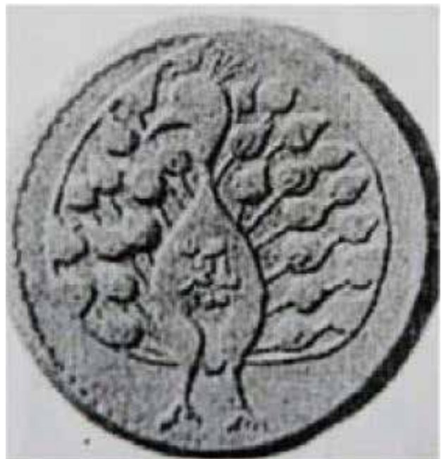
تصویر ۸. سکه طلا مربوط به دوره قاجار.