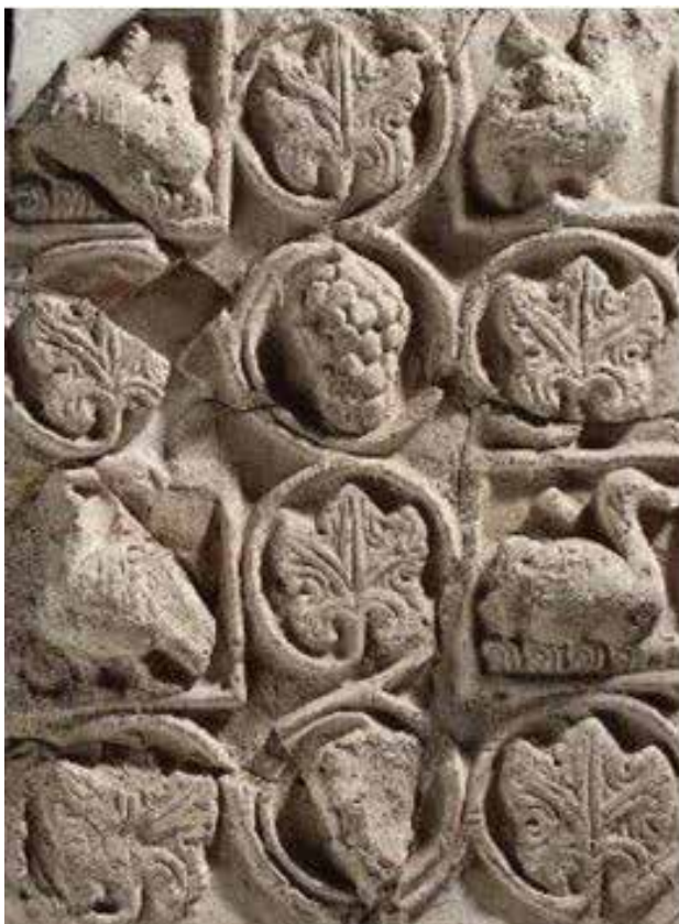
تصویر ۱۰. گچبری با نقش پرند بر شاخه انگور، چال ترخان.