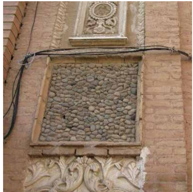
تصویر ۴. سنگ رودخانه‌ای به کار رفته در بخشی از نمای خانه شربت‌اوغلی تبریز. عکس: سمیه جلالی میلانی، ۱۳۹۵.

ای ز غم فراق تو جان مرا شکایتی بر در تو نشستیم، منتظر عنایتی