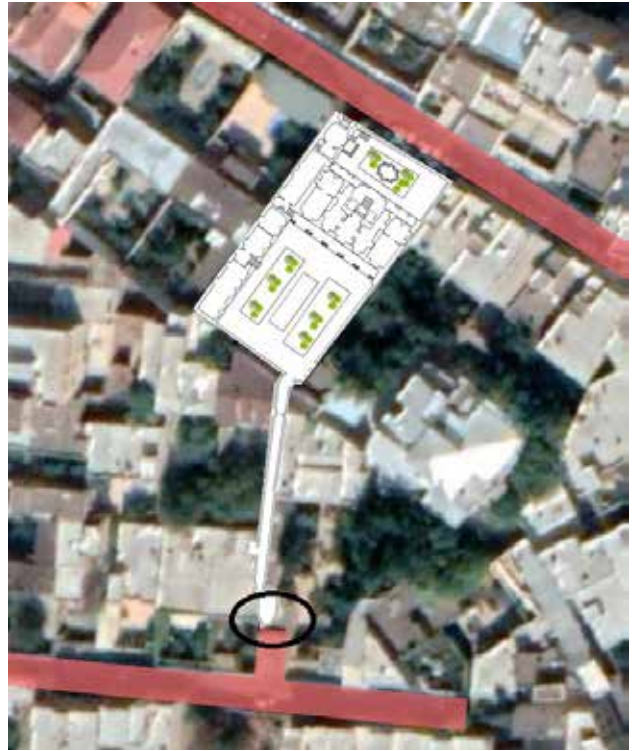
تصویر ۱. پلان خانه شربت اوغلی و جانمایی نمای مورد مطالعه در آن.

در رابطه با معنای بیانی نما و چگونگی توصیف آن اشاره به مثالی از خود پانوفسکی بسیار مفید است. او در این رابطه، ویژگی‌های آرامش‌بخش و دنج برای یک فضای داخلی را نمونه‌ای از معنای بیانی معرفی کرده است (پانوفسکی، ۱۳۹۵، ۳۷) که مشخصاً مثالی در حوزه معماری است. در ارتباط با نمای خانه شربت‌اوغلی، به واسطه قوس مرتفع میانی، خطوط عمودی و گچبری‌های کشیده در دو طرف آن، تأکیدی بر محور عمودی قابل مشاهده است؛ هرچند این تأکید با خطوط افقی