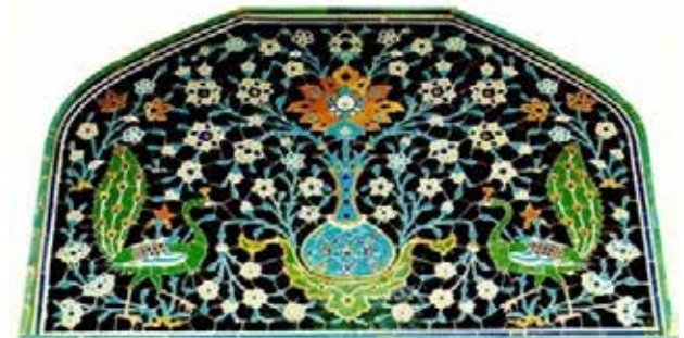
تصویر ۷. نقش مایه‌های دو طاووس و درخت زندگی، سردر مسجد امام اصفهان، دوره صفویه.

کار رفته است؛ به طوری که این تصویر در معماری بناهایی با کارکرد غیر مذهبی نیز دیده می‌شود (تصویر ۹). به این ترتیب با آگاهی یافتن از معانی نقش مایه‌های به کار رفته در گچبری سردر خانه شربت‌اوغلی، برای تفسیر آیکونولوژیک نمای این خانه فرضیه‌ای به ذهن می‌رسد؛ و آن اینکه سردر ورودی تعبیه شده در این نما، منقش به آرایه‌هایی شده است که به طور نمادین دلالت‌کننده بر خوش‌آمدگویی و طلب خیر برای عبورکنندگان از آن‌اند. به عبارت دیگر سازندگان نما و صاحبخانه در آرزوی ساختن بهشتی زمینی در فضای این خانه، و دور کردن پلیدی‌ها، بلاها و شیاطین از خانه و واردشوندگان به آن، و افزایش برکت روزی، دست به دامان چنین نقشی بر روی نمای رو به بیرون خانه شده‌اند. علاوه بر این سرشناس بودن مالک خانه و برخوردار بودن او از وضعیت مطلوب مالی این فرض را تقویت می‌کند که صاحبخانه تمایل داشته است تا طلب خیر برای واردشوندگان به خانه‌اش را کمابیش از طریق نمایش موقعیت اجتماعی خود به آنها به