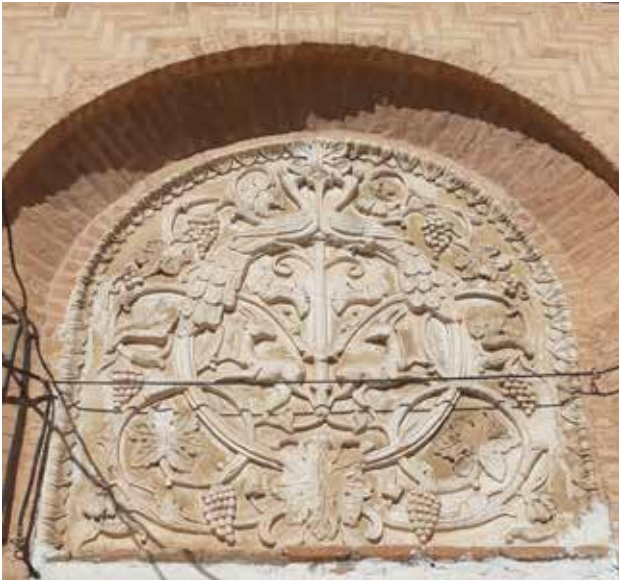
تصویر ۵. گچبری سردر خانه شربت اوغلی تبریز.

درونمایه درخت زندگی از بین‌النهرین ریشه گرفته و ایرانی‌ها، بیزانسی‌ها و اعراب آن را به شرق دور برده‌اند ( پورخالقی چترودی، ۱۳۸۰، ۹۶ ). در فرهنگ ایران باستان مار (زدها) نماد اهریمن دانسته می‌شد که در پی تسلط بر درخت زندگی است؛ چیزی که پیامد آن بلایایی مانند خشکسالی است. از این رو در تصاویر همیشه نگهبانانی برای محافظت از این درخت و میوه‌های آن گمارده می‌شد که اغلب جانورانی چون بز کوهی، طاووس، آهو و گاه جانوران افسانه‌ای و ترکیبی مانند گاو بالدار، شیر بالدار و غیره هستند ( خزایی، ۱۳۸۶، ۹ ). مفهوم درخت زندگی پس از اسلام به واسطه برخی مفاهیم مشابه در قرآن کریم همچون درخت طوبی و سدره‌المنتهی تعدیل شد و به حضور خود در آثار هنری و معماری ادامه داد. نقش‌مایه این درخت به همراه دو طاووس در دو سمتش در آرایه‌های معماری - و همچنین در نقوش روی آثار دیگری همچون پارچه‌ها، فرش‌ها، ظروف و غیره - بارها به کار گرفته شده است. این تصویر به‌ویژه در سردر بسیاری از مساجد و اماکن مذهبی به کار بسته شده ( تصویر ۷ )، و این موضوع به این صورت توضیح داده می‌شود که چون طاووس مرغی بهشتی دانسته می‌شد، حضور آن در سردر مساجد به معنای خوش‌آمدگویی و راهنمایی مردم به داخل مسجد بوده است ( همان، ۱۱ ). همچنین طاووس می‌توانسته نگهبان این اماکن از گزند پلیدی‌ها و شیطان در نظر گرفته شود ( هیلن براند، ۱۳۷۹، ۵۵ ). در دوره قاجار بهره‌گیری از نقش‌مایه طاووس حتی بیشتر شد. سکه‌ای از دوره قاجار با طرح طاووس که بر روی بدن آن نام پیامبر اسلام ضرب شده ( پوپ و آکرمن، ۱۳۸۷، ۱۴۸۷ )، یادآور مفهوم طاووس به عنوان نمادی از پیامبر است که پیش‌تر ذکر شد ( تصویر ۸ ). ضمن اینکه تصویر طاووس به همراه درخت زندگی همچنان در هنر و معماری این دوره به