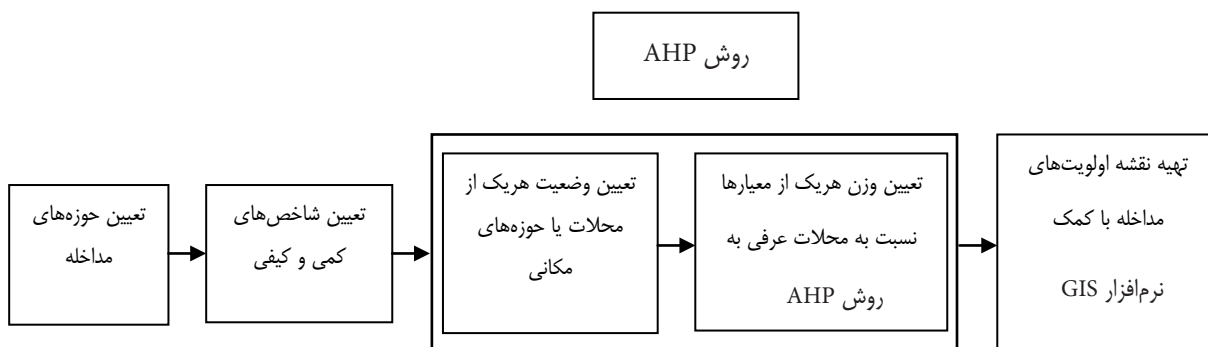
شکل ۲. فرآیند تعیین حوزه‌های مداخله.