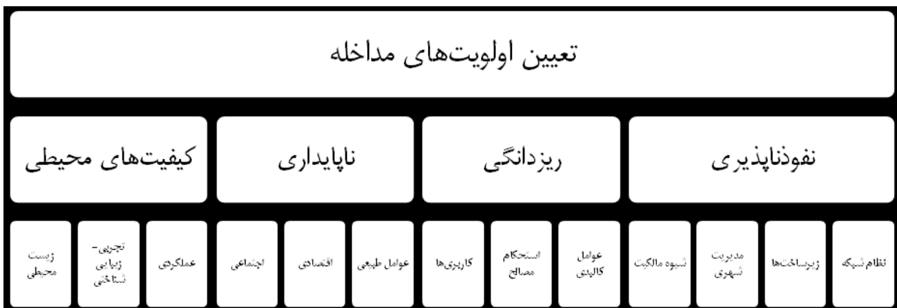
شکل ۱. شاخص‌ها و سنجه‌های تعیین اولویت‌های مداخله در بافت‌های فرسوده.