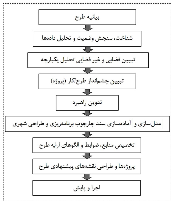
تصویر ۲. مدل مفهومی رویکرد برنامه‌ریزی طراحی محور (DLP).

شهر به طور پیوسته و مداوم نیاز به برنامه‌ریزی و طراحی دارد. برای برطرف کردن و کاهش مشکلات شهری همواره باید برنامه‌هایی از سوی مدیران شهری تعریف شود تا متناسب با شرایط موجود برای رفع کمبودها و نارسایی‌ها اقداماتی صورت گیرد. در ابتدای شروع هر طرحی پس از بیان کلیات، مبانی نظری و نمونه‌های مشابه انجام شده در فصل‌های جداگانه، در این بخش و در قالب مدل مفهومی (DLP)، لازم است به صورت مختصر به بیان موضوع مورد بررسی پرداخته و طرح مورد نظر تدقیق شود. در ادامه محدوده مداخله و بلافاصله با تأکید بر موقعیت مکانی دقیق آنها و با استفاده از GIS و RS نشان داده شود تا موقعیت طرح مورد مطالعه و ویژگی‌های مکانی آن مشخص شود. با در نظر گرفتن ماهیت طرح و جایگاه آن، لازم است که در اسناد فرادست به منظور شناخت اولیه از محدوده و تبیین بستر سیاسی طرح، کنکاش صورت گیرد. در انتهای مرحله اول، چشم‌اندازی کلی و مقدماتی برای تصویرسازی از یک آینده مطلوب برای محدوده مطالعاتی بیان شده و طیف مختلفی از سیاست‌های طراحی که در نقاط معینی از فرآیند DLP تمرکز یافته تا متقاضیان صدور پروانه بتوانند نسبت به طیف کاملی از مباحث