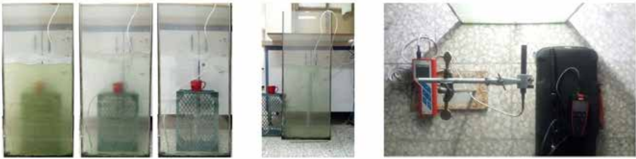
تصویر ۳. زیست رآکتور ساخته شده و تجهیزات مورد استفاده در فرایند آزمایش.

جداره‌های ساختمان و بدنه‌های شهری را با این زیست رآکتور پوشش داد، در بازه زمانی بسیار کوتاه می‌توان میزان دی‌اکسید کربن موجود در هوا را به مقدار قابل توجهی به صورت پایدار کاهش داد و در جهت ارتقای بهبود کیفیت هوا و حفظ و پایداری محیط زیست شهری به‌عنوان سیاست و هدف اصلی این نوشتار، گام مؤثری برداشت.