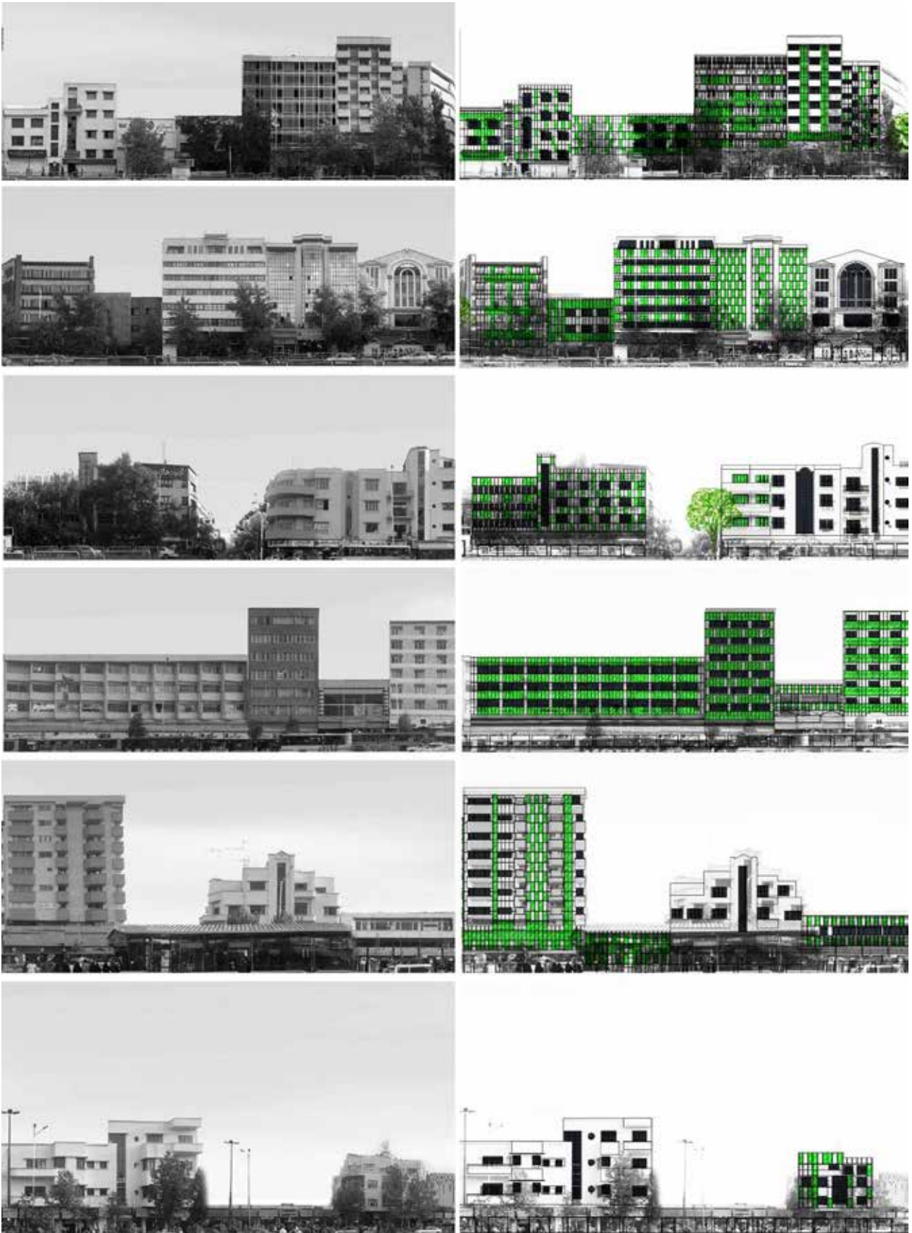
تصویر ۱. ب) مقایسه سیمای شهری جبهه جنوبی خیابان انقلاب با در نظر گرفتن پانل‌های حاوی ریزجلبک.