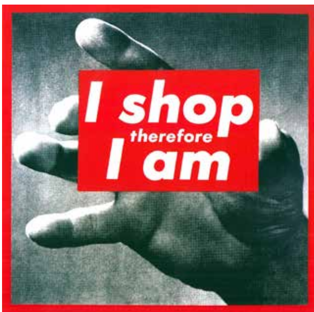
تصویر ۲. «من خرید می‌کنم، پس هستم» اثر باربارا کروگر. مأخذ: سمیع آذر، ۱۳۹۲، ۹۴.

این اثر باربارا کروگر نوعی نقد به بستر فرهنگی-اجتماعی دوران مدرن است. ارائه قراردادهای جدید و نفی شیئیت و انتقال ایده هنرمند و به‌چالش کشیدن ذهن مخاطب نیاز به بستر فرهنگی-اجتماعی‌ای دارد که جهان هنر در آن به فعالیت فرهنگی می‌پردازد. از این رو در آثار باربارا کروگر کاملاً به پدیده‌های زندگی فرهنگی اعضای جهان هنر اشاره