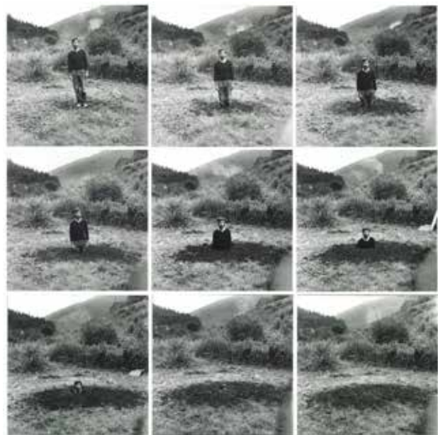
تصویر ۳. «خود خاکسپاری» نه قطعه عکس روی کاغذ، اثر کیت آرنت، ۱۹۶۹.

ناگزیر به این پندار منجر می شود که خود هنرمند نیز عاقبت ناپدید خواهد شد» (Wood, 2002, 37).