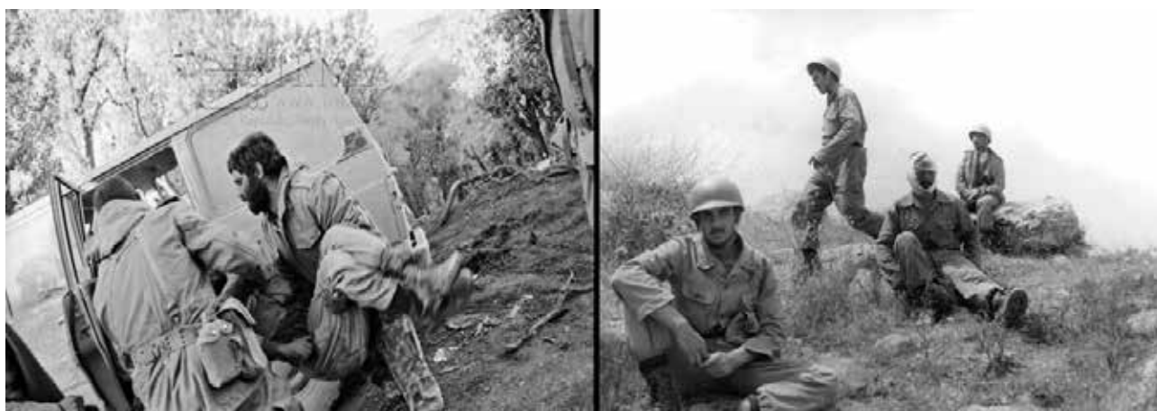
تصویر ۳. تأکید بر ارزش‌ها و مفاهیم شهادت در عکاسی عملیات والفجر مقدماتی.