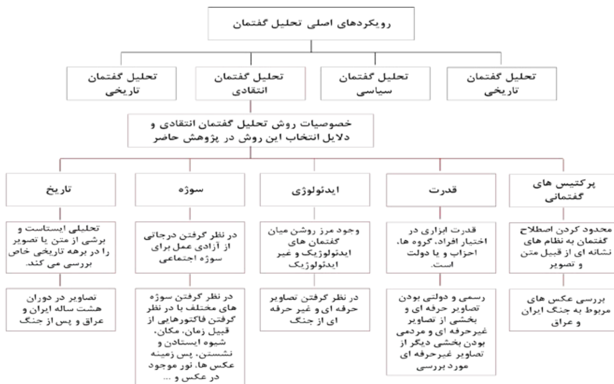
تصویر ۱. رویکردهای اصلی تحلیل گفتمان و ویژگی‌های تحلیل گفتمان انتقادی. مأخذ: خونساری، ۱۳۹۸.

مورد فکه نگاه رسمی، عملیات والفجر مقدماتی را شکستی بزرگ به حساب آورد تا جایی که نام‌گذاری این عملیات پس از شکست، به عنوان «مقدماتی» تأییدکننده این موضوع است. این در حالی است که در روایت مردمی، عملیات والفجر مقدماتی یک پیروزی است و تجلی هویت مسلمان شیعه در تاریخ معاصر است. کانال کمیل به سبب شهادت مظلومانه بسیاری از رزمندگان، ظهر عاشورا پذیرای عده زیادی از مردم شهرهای دور و نزدیک برای برگزاری مراسم ظهر عاشورا است. موقعیت افراد محاصره شده در کانال، سختی‌ها و مقاومت‌های روایت‌شده از رزمندگان باقی مانده گردان‌های «کمیل» و «حنظله» باعث شده که مردم رزمندگان این کانال را شبیه به سپاهیان امام حسین (ع) در روز عاشورا بدانند (گروه فرهنگی شهید ابراهیم هادی، ۱۳۹۱، ۱). در واقع وقتی رزمندگان در میان دو تپه منطقه عملیاتی فکه محاصره شدند بعد از سه روز مقاومت با لب تشنه قتل عام شدند، بنابراین این منطقه به «قتلگاه عاشورا» معروف شده است. حتی بعد از سقوط فکه و وقتی پاسگاه‌های منطقه سقوط کردند، نیروهای مستقر هنگام عقب‌نشینی راه را گم کرده و به دلیل تشنگی به شهادت رسیدند (ربیعی و تمنایی، ۱۳۹۲، ۱۰). • عکس جنگ به مثابه متن علیرضا کمری می‌گوید: «سرشت زبان فارسی ادبی است ... وقتی کسی می‌گوید (داستان آن مرد...)، از سطح آهنگ کلام تا خود کلمه‌ها و جمله‌ها و عبارات کاملاً ادبی یا تصویرسازی ادبی هستند- بی‌آنکه شخص آن را اراده کرده باشد» (کمری،