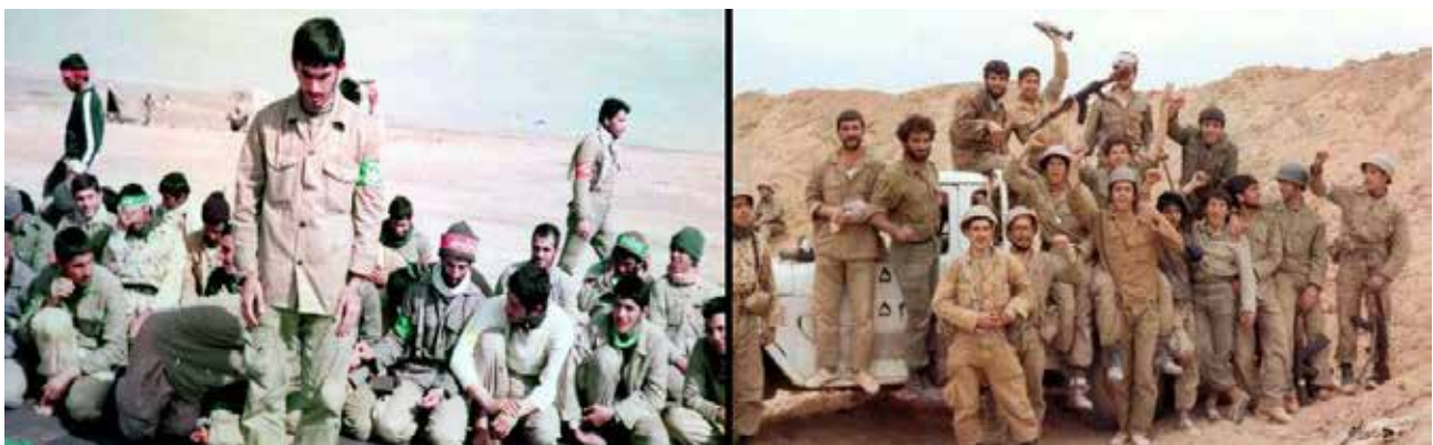
تصویر ۵. تنوع در لباس‌های رزمندگان به واسطه وابستگی نظامی آن‌ها.