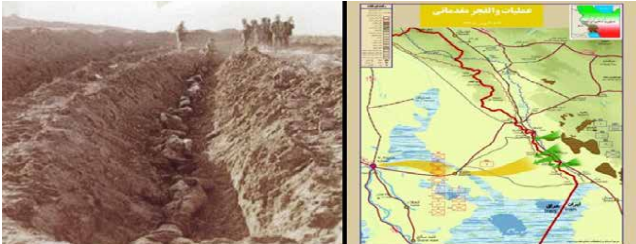
تصویر ۴. محدوده جغرافیایی عملیات والفجر مقدماتی.

نور موجود در عکس: در مجموعه تصاویر عملیات والفجر مقدماتی، رنگ نوری عکس‌هایی که در کوهستان عکاسی شده با عکس‌های دشت تفاوت دارد. عکس‌های کوهستان تنالیت‌های تیره دارد و عکس‌های دشت تنالیت‌های روشن (تصویر ۸ و جدول ۶). پیش‌زمینه و پس‌زمینه عکس‌ها: در پس‌زمینه و پیش‌زمینه