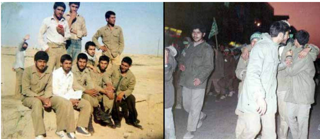
تصویر ۸. نور موجود در عکس.