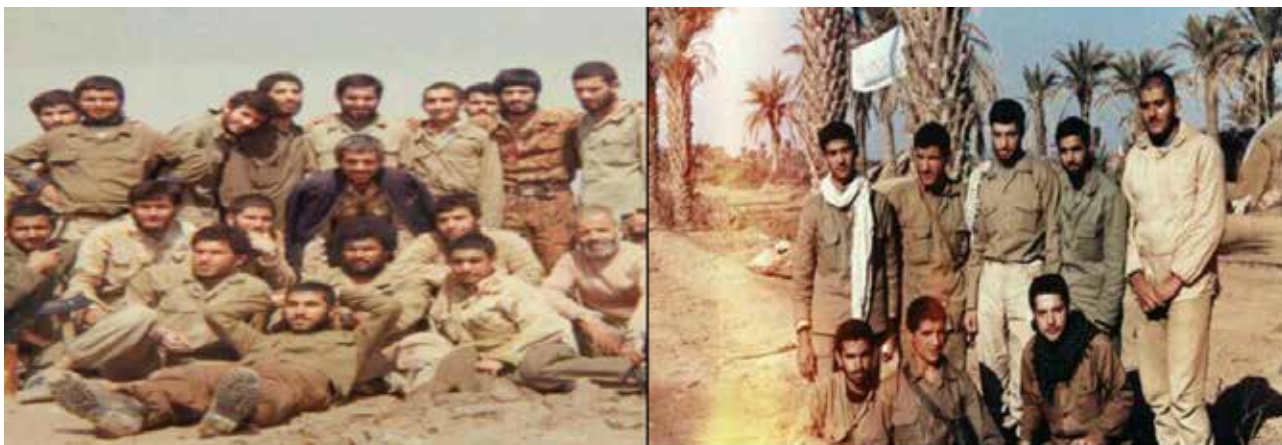
تصویر ۷. شیوه ایستادن و نشستن رزمندگان.