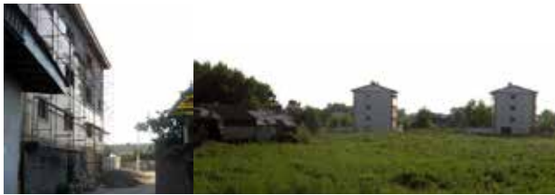
تصویر ۳. ساخت مسکن در زمین‌های زراعی و بدون توجه به بافت مجاور (راست) و ساخت‌وساز گسترده در کوچه‌های باریک (چپ).