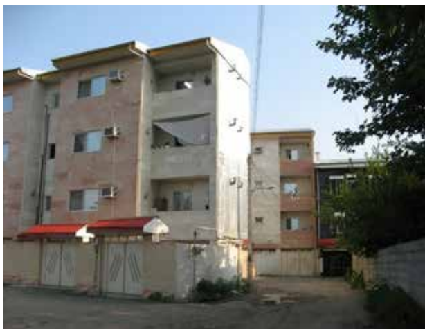
تصویر ۴. رشد فضاهای مسکونی بدون توجه به نیاز ساکنان و معماری بومی منطقه.

کیفی تقسیم می‌شوند. شاخص‌های کمی مسکن شامل تراکم خالص و ناخالص، تراکم خانوار، تراکم نفر در واحد مسکونی، متوسط تعداد اتاق در واحد مسکونی و نسبت رشد خانوار به رشد مسکن می‌شود و شاخص‌های کیفی مسکن نیز نحوه تصرف محل سکونت و وضعیت فیزیکی واحدهای مسکونی را در بر می‌گیرد.