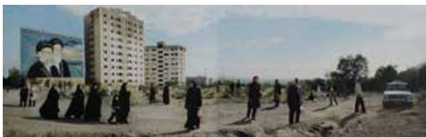
تصویر ۵. تهران، عکس از: میترا تبریزیان. مأخذ: Amirsadeghi, 2009, 44.