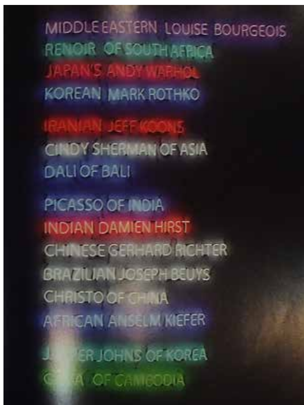
تصویر ۴. لحظه افتخار ۱، عکس از لیلیا پازوکی. مأخذ: Keshmirshekan, 2013, 329.