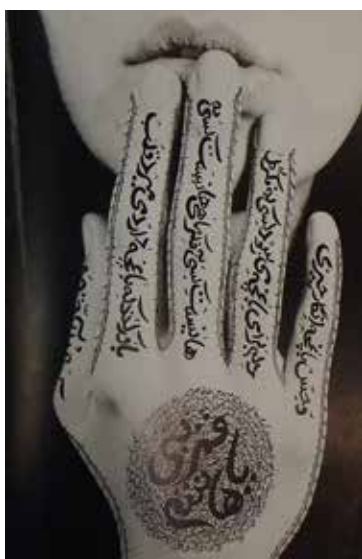
تصویر ۷. بدون عنوان، از مجموعه زنان الله، عکس از شیرین نشاط.

مکانی خاص یعنی ایران را میسر کند. نمونه‌ای که برای پایان بحث انتخاب شده است به‌خوبی همه شاخصه‌های نمایه‌ای مذکور در این پژوهش را در خود جای داده است (تصویر ۸). هنرمند با انتخاب، جداسازی و قاب‌بندی مکانی در نقشه جهان به جایی اشاره می‌کند. اشاره او به «اینجا» است: جوهره همه آثار پیشین، چیزی خاص، یکتا و منحصر به‌فرد، دالی تهی که چون بدان اشاره می‌شود نیازمند الحاق «گفتمان» است. نوشتار خوشنویسی شده و حتی تصویر افرادی که با افشاندن رنگ بر روی آن ایجاد شده این گفتمان را فراهم می‌کنند. افرادی که گویی در تصاویر پیشین نیز وجود دارند (تصویر ۵). اما خود نوشته «اگه بشه چی میشه» باز هم به عبارات نمایه‌ای و ضمیرهای اشاره مربوط می‌شود، چیزی که درون آن نهفته است؛ اشاره به این، اینجا، اکنون، زمان گذشته و آینده و به دال‌های تهی، و به گفتمان‌های الحاقی ممکن دیگر.