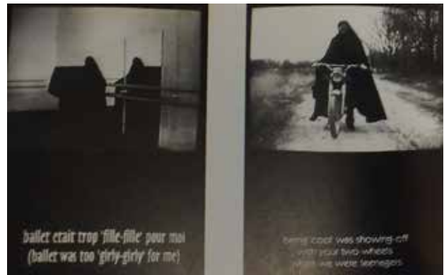
تصویر ۱. من، از مجموعه ویدئو، غزل.

• ضمایر اشاره (برای مثال «این») از هر محتوایی تهی هستند و به‌سادگی شیء یا موقعیت منفرد و یگانه‌ای را نشان می‌دهند که صرفاً درون گفتمانی خاص درک می‌شود. این ضمایر اشاره مستقیماً به چیزها اشاره می‌کنند. آن‌ها صراحت و سراسرستی و فوریتی دارند که همه اسم‌ها فاقد آن هستند. نمایه‌ها اطمینانی قطعی از واقعیت و نزدیکی ابژه‌ها را فراهم می‌آورند. آن‌ها به سادگی نشان می‌دهند که چیزی «اینجا» هست.