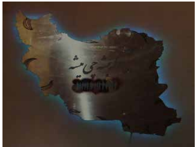
تصویر ۸. بدون عنوان، از مجموعه لبه، عکس از بهنام کامرانی. مأخذ: Kesh - mirshekan, 2013, 262.

به بافت زندگی در شرق دارد و نگاهی تعمیم‌دهنده را بر این بافت‌های گزینش شده رواج می‌دهد، ضمن اینکه عمل انتخاب و جداسازی را با نشان دادن جایی در مکان واقعی و ملموس انجام می‌دهد تا گفتمان شرق‌شناسی را واقعی نشان دهد، به‌علاوه صفاتی مثل دیگری، عجیب و غریب، عقب‌مانده و ... را با شرق هم‌نشین می‌کند که هر یک، براساس رابطه مبتنی بر مجاورت، ظرفیت یادآوری دیگری و در نهایت مکان را فراهم می‌کند. در نهایت این که انگشت اشاره‌ای را به شکل دائمی به نقطه‌ای خاص در جهان هدف می‌گیرد که می‌تواند هر لحظه گفتمانی را بر آن تحمیل کند. بنابراین شاخصه نمایه‌ای هنر معاصر ایران در تطابق با گفتمان شرق‌شناسی است که خود واجد وجه نمایه‌ای است و بر این اساس، بدون کمترین رمزگذاری لازم، به‌شکلی سراسرت، معنی خود را القا و تحمیل می‌کند. آنچه موجب استمرار گفتمان شرق‌شناختی می‌شود اتکا بر ویژگی نمایه‌ای آن است که گویی سخن از چیزی واقعی می‌گوید.