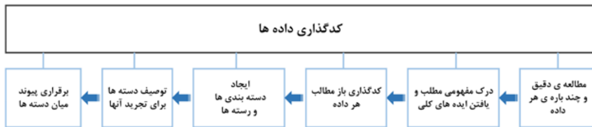
تصویر ۱. کنش های مرحله کدگذاری داده های کیفی. مأخذ: نوروز برازجانی، ۱۳۹۷، ۲۶۲.