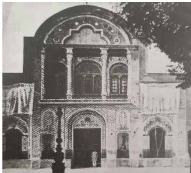
تصویر ۲. بالا: سردر بانک شاهنشاهی، استفاده از طاق‌های نیم‌دایره‌ای رومی، سنتوری‌های بالای سردر و سرستون‌های کرتین. پایین: استفاده از سنتوری و تاج بالای سردر.

آنها بود، اما در دوره قاجار شاهد هستیم که رنگ‌های گرم مانند قرمز و نارنجی و سفید بر رنگ‌های سرد تقدم پیدا می‌کنند. به علاوه در نقوش تزیینات نیز شاهد تغییر و تحولی هستیم و نقش‌های طبیعی و موجوداتی مانند گل و درخت به آنها اضافه می‌شوند (زابلی‌نژاد، ۱۳۸۷). سنتوری‌های مثلثی یا منحنی‌شکل بالای نما و سرستون‌های سبک یونانی و قوس‌های نیم‌دایره‌ای نیز همان‌گونه که در تصویر ۲ قابل مشاهده است، از مصادیق قابل ذکر تأثیر معماری غرب بر معماری قاجار بوده‌اند (سعادت‌ی خمسه، ۱۳۹۵).