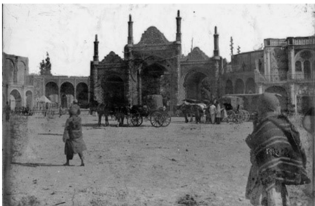
تصویر ۱. نمونه‌هایی از دروازه‌های تهران در دوره قاجار. بالا: دروازه ارگ تهران، وسط: دروازه چراغ گاز پایین: دولت تهران.

هنر اروپایی، رد پای هنر و فرهنگ چین و هند نیز در آثار معماری این دوران دیده می‌شود، به خصوص در ولایت کرمان که از دوران صفوی کم‌کم تبدیل به شهری درجه یک شد.