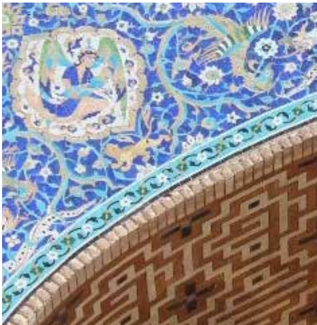
تصویر ۱۱. عناصر الهام گرفته شده از غرب و اروپا، دوران صفوی. شمایل مادر و فرزند، کاروانسرای گنجعلی خان. عکس: مینا صافی‌زاده، ۱۳۹۷.