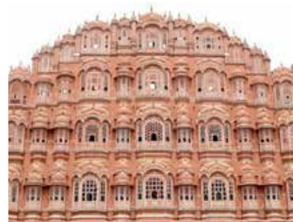
تصویر ۳. نمونه‌هایی از معماری هندی. الف: هوامحل در جیپور؛ وجود گنبد‌های نوک تیز در نما. مأخذ: www.thrillophilia.com . ب: آرامگاه گل گنبد در بیجاپور؛ استفاده از گنبد‌های با قوس تیزه‌دار و تزئین دالبری شکل. مأخذ: بتلی، ۱۳۸۹. ج: عمارت تاج محل، تعدد ستون‌ها در ورودی بنا. مأخذ: بتلی، ۱۳۸۹.