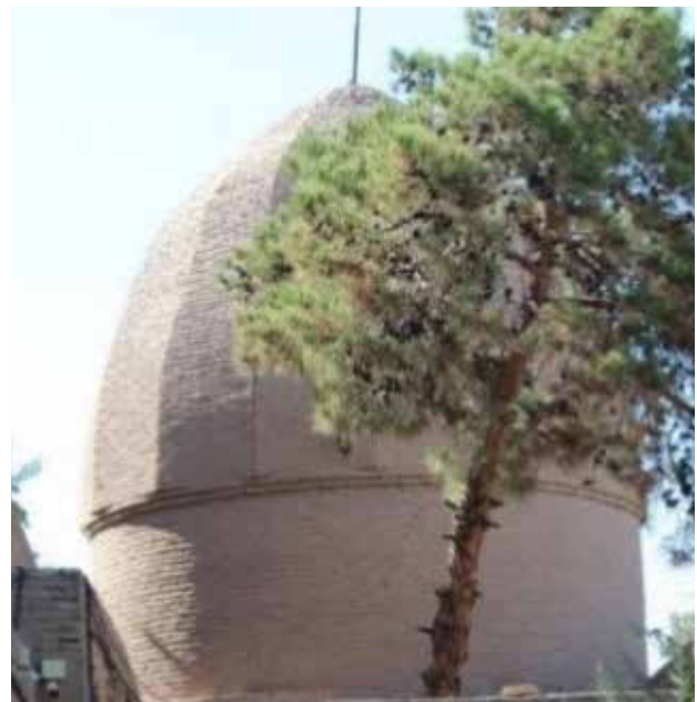
تصویر ۹. عناصر الهام گرفته شده از هند، دوران قاجاریه. گنبد پیازی شکل آجری مجموعه مشتاقیه، عکس: مینا صافی‌زاده، ۱۳۹۷.

دوران صفوی به بعد تنوع زیادی در نوع و اصالت تزیینات به چشم می‌خورد به عنوان مثال در سردرهای بناهایی مانند کتابخانه ملی که متعلق به دوران پهلوی است، خبری از لچکی‌های پر نقش‌ونگار دوره صفویه دیده نمی‌شود. تنوع رنگی به کاررفته در اسلیمی‌ها و ختایی‌ها نیز اینجا قابل تشخیص نیست. از سوی دیگر جواد در مقاله «بررسی و تحلیل تزیینات معماری در مجموعه گنج‌علی‌خان شاهکاری از هنر عصر صفوی در کرمان» به دقت جزئیات زیبایی‌شناسی تزیینات بناهای این مجموعه را مورد بررسی قرار می‌دهد. وی در رابطه با سردر آب‌انبار مجموعه این چنین توضیح می‌دهد: «ورودی قوسی انبار در وسط دیوار مقابل قرار دارد. در بالای قوس لچکی‌هایی با زمینه آبی و نقوش گل و بته و ترنج و اسلیمی با رنگ سفید و رنگ زرد و سیاه دیده می‌شود. نقش ترنج‌های بزرگ که در مرکز لچکی قرار دارند، با دیگر ترنج‌هایی که در سایر لچکی‌های این مجموعه متفاوت است. این ترنج‌ها دارای شکلی کشیده هستند که داخل آن ترنجی کوچک دیده می‌شود» (جوادی، ۱۳۸۷).