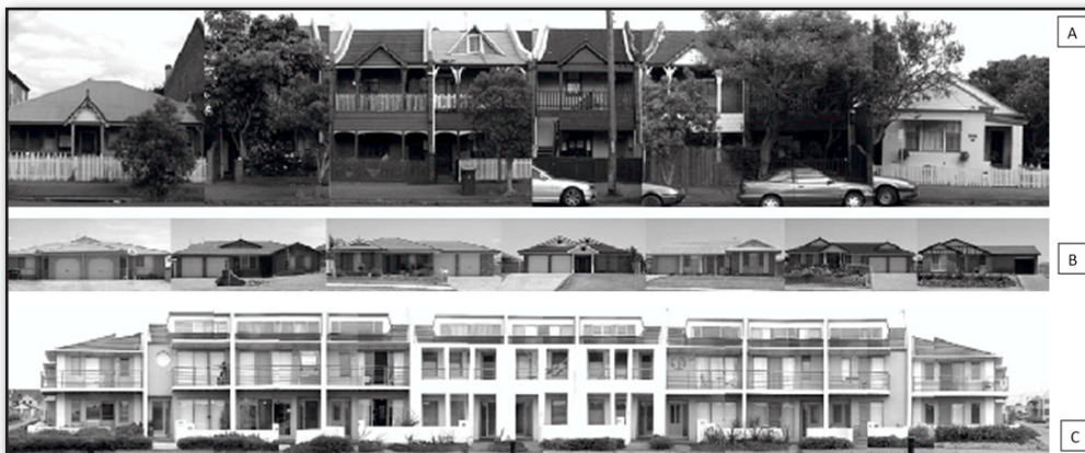
تصویر ۱: سیمای خیابان A، B و C. Tucker, Ostwald, Chalup and Marshall, 2005

عکس‌ها بیشترین کاربرد را در تحلیل‌های بصری شهر دارند. البته در بسیاری از موارد لازم است برای تحلیل‌های بصری ترکیبی از