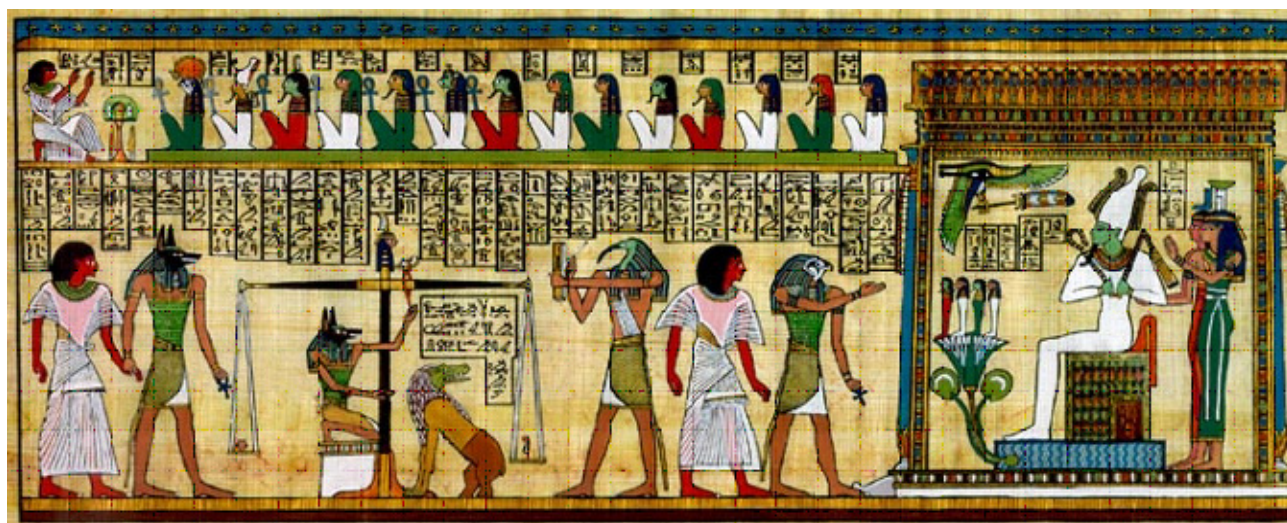
تصویر ۲: تصویر زندگی پس از مرگ و قضاوت مردگان توسط ازیریس. در این تصویر، رنگ‌ها، تناسبات و عناصر ترکیبی از واقعیت و خیال است و بسیاری از عناصر به کار گرفته شده در تصویر، مفاهیم نمادین دارند.