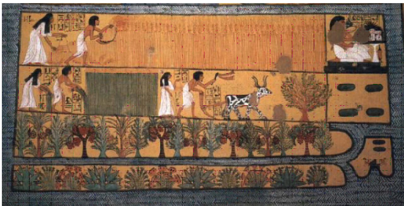
تصویر ۱. نمایش زندگی روزمره، مردم در حال کشاورزی. در این تصویر، رنگ‌ها، تناسبات و عناصر همه مطابق با واقعیت هستند و اثری از عناصر نمادین دیده نمی‌شود. مأخذ : Marie & Hagen, 1999: 171

در این تصویر استفاده از این مفهوم رنگ زرد دیده می‌شود. همچنین موی آنوبیس و مومیایی آبی رنگ است که سمبل کیهانی بودن آنان است. لباس زنان عزادار و کاهنان، سفید رنگ است که نماد اجرای مراسمی آیینی و مقدس است. در تصویر زیر نیز، استخوان‌های طلایی رنگ مومیایی و موهای آبی رنگ خدایان دیده می‌شود. رنگ غالب در تصویر زیر، سیاه، سفید و طلایی است که در تمامی تصویر دیده می‌شود.