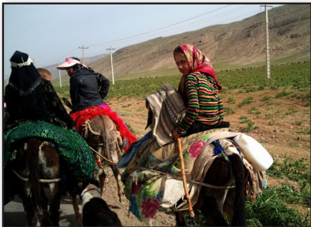
تصویر ۲. کودکان و توانمندی در کوچ، پادناي سمیرم. Fig. 2. Children and their capabilities in migration - Padena Samirom

این آسایش رفتاری همچنان به دلیل وجود گستردگی خانه‌ها در دل دشت و فاصله طبیعی بین چادرهاست که امکان وجود دید مستقیم یا انتقال صدای مشخص را به حداقل رسانده و به طور مؤثری به ایجاد خلوت منجر می‌شود. ۲۰ در نمونه‌های اخیر مورد