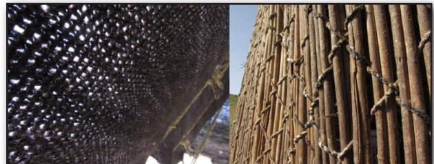
تصویر ۵. ادراک لمسی، جداره‌های خانه از چیغ و بافت درشت سیاه‌چادر در برانگیختن حس لامسه مؤثر است.

ادراک لمسی به عنوان یک حوزه قوی نفوذ به جهان شناخته شده، که عمق تجربه در مقایسه با ادراک بصری و ماندگاری و قدرت یاری بخشی آن به بازخوانی حافظه قابل توجه است. در این زندگی، مکان با استفاده از سرپناهی معنا پیدا می‌کند که با دست بافته شده است و به لباس شباهت پیدا می‌کند. تهییج مداوم ادراک لمسی از تفاوت‌های بسیار مهم زندگی عشایری با زندگی شهری است. تجربه یک یورد عشایری با تجربه و ارتباط دست با پوست و پشم حیوانات، آبی که از چشمه می‌جوشد، گل‌ها و گیاهان صحرایی که در پخت غذا و برای رنگ آمیزی پشم در دست بافته‌ها کاربرد دارد، در کنار تجربه پای انسان از تفاوت نرمی سطوح پوشیده از خاک، سنگ و علف موجب می‌شود تصویر بدنی این افراد در زندگی شهری تطابق با تصویر عشایری آن نداشته باشد (تصویر ۵).