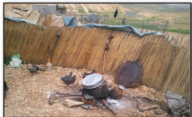
تصویر ۶. حس فهم دما، اجاق و نقش مؤثر آن در زندگی عشایری.

به عنوان یک تفاوت مهم بیرون و درون در معنا بخشیدن به مفهوم مسکن موفق عمل می‌کند، این حس مانند سایر حواس به حافظه ما متصل است. در زندگی عشایری به دلیل حضور کمتر وسایل تنظیم‌کننده درجه حرارت، مواجهه طبیعی با جهان و ادراک تنوع حرارتی، امکان‌پذیر است. تجربه دماهای پایین هوا در فضای بیرونی و شب‌های خنک بیلاقی و نقش گرمابخش و سرنمونی آتش، نقش مؤثر آن را در القای حس مسکن، تشدید می‌کند (تصویر ۶) همچنین نقش خنک‌کننده چادر در طی روز آن را دلخواه می‌کند.