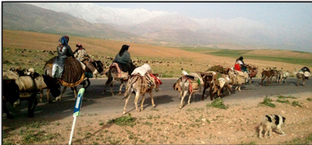
تصویر ۳. ادراک سمعی، پدیده کوچ به عنوان بخش مهمی از زندگی عشایری با صداها و بوی ویژه خود همراه است.

با آداب و رسوم به خصوص این قوم هماهنگ است در کنار صدای صحبت انسان‌های آشنا از دیگر خصوصیات زندگی در یک مکان عشایری است (تصویر ۳).