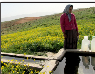
تصویر ۴. ادراک بویایی در زندگی عشایری، آب چشمه در کنار گیاهان صحرائی.

صداها و بوی مکان‌ها به همان اندازه در ادراک محیط سهیم‌اند، که حس بینایی در آنها مشارکت دارد. یک رایحه در برانگیختن حافظه قوی‌تر از حس بصری عمل کرده و وارد فازهای ناخودآگاهی می‌شود. معماری نیز می‌تواند واجد حس بویایی باشد، رایحه محل سکونت، با ویژگی‌های به خصوصی که در هر مکان پیدا می‌کند در تصویر ذهنی انسان از محل سکونت وی نقش مؤثری دارد. غالباً «یک بوی ویژه باعث می‌شود دوباره وارد فضایی شویم که حافظه بصری به کل آن را فراموش کرده باشد» (پلاسما، ۱۳۸۸: ۶۷) در یک مکان سکونت عشایری، خانه به دلیل قرارگیری بی‌واسطه در طبیعت اغلب با روایح بسیاری همراه است. عطر گیاهان وحشی در محیط کلی فضای یورد احساس شده و در کیفیت غذای طبخ شده و آبی که از چشمه نوشیده می‌شود مؤثر است. همچنان که جداره‌های خانه مانعی در برابر رایحه محسوب نمی‌شود. در بازدید از شهرک‌های عشایری، دلتنگی برای هوای آزاد از مهم‌ترین عواملی محسوب می‌شود که تحمل شهرنشینی را دشوار می‌کند. همچنین به دلیل تمایل استفاده از هوای آزاد و رایحه مراتع ترجیح به زندگی در سیاه‌چادر با وجود عدم امکان امتداد زندگی عشایری به لحاظ تفاوت در امکانات معیشتی همچنین وجود دارد (تصویر ۴).