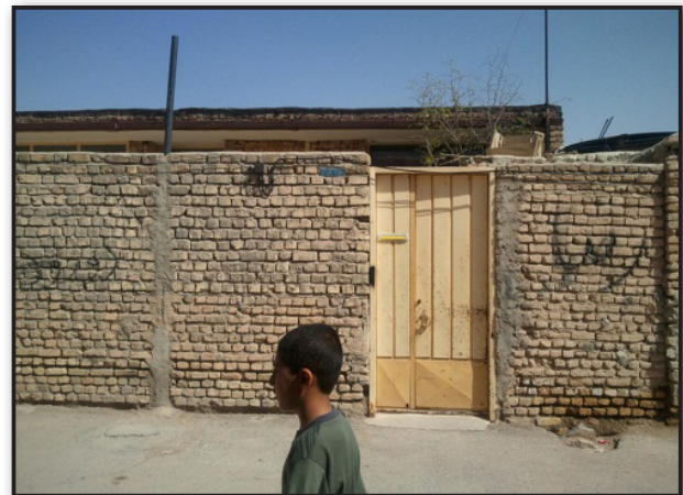
تصویر ۱. انفعال کودکان در اسکان، شهرک عشایری خمینی‌آباد. مأخذ: نگارندگان، ۱۳۹۰. Fig. 1. Children passivity in settlement - Khomeini Abad nomadic town, Source: authors, 2011.