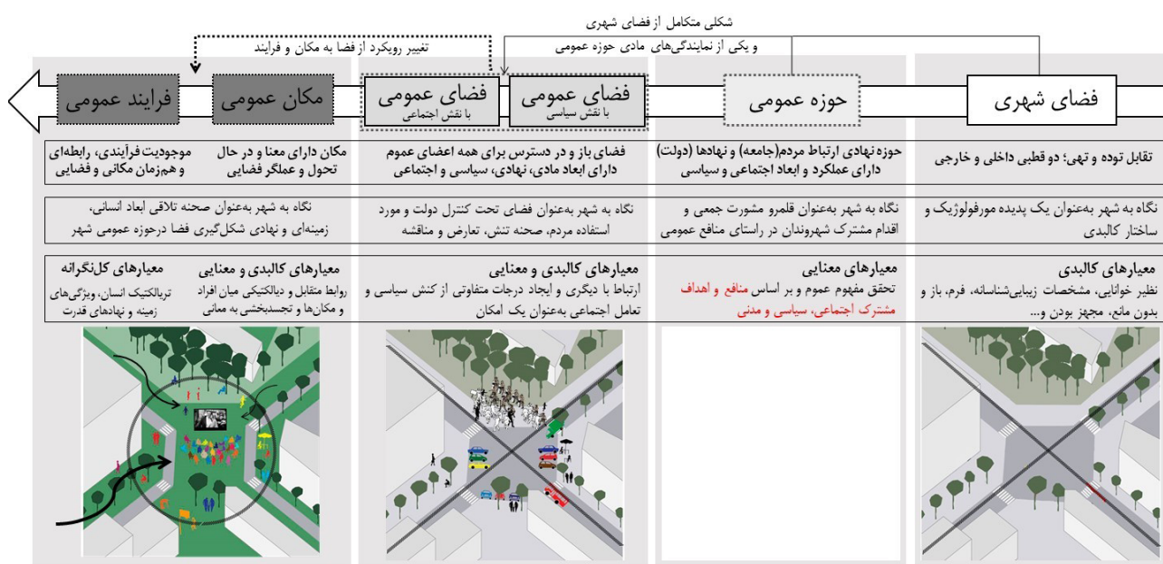
تصویر ۱. تحول معنایی فضا در حوزه عمومی شهر از فضای شهری به پدیده‌های چندوجهی و فرآیندی.

کیفیت و ساماندهی کالبدی مناسب شامل محافظت، امنیت، فضاسازی صحیح، مبلمان متناسب و چندمنظوره، برخورداری از فضای مناسب نشستن، سرپناه داشتن از شرایط آب و هوایی نامساعد، کیفیت بصری و پرداختن به جزئیات، غنای محرک‌های حسی مؤثر بر تجربه حسی فضا، با تأثیرگذاری بر الگوهای رفتاری