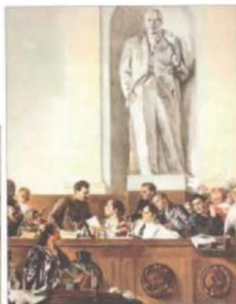
تصویر ۳. تصویری از هنر رئالیسم سوسیالیستی مورد حمایت حاکمیت شوروی سابق و مصداقی از خاصیت شکلدهی هنر.

نظام‌های توزیع هنر نیز به مثابه «کارگزار ارتباطی» می‌توانند با تعامل یا تقابل با موضوعات و محتواهای آثار هنری به طور مستقیم در برجسته‌شدن یا انزوای هرگونه ایده، سبک یا جریان هنری خاص نقش داشته باشند.