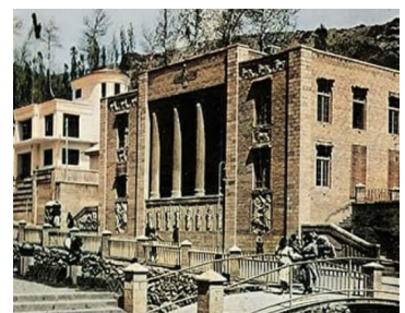
تصویر ۶. خصلت یکپارچه سازی گفتمان حتی در فرم معماری. از راست: کاخ شهربانی. غرفه ایران در نمایشگاه هلسینکی. کلانتری دربند.