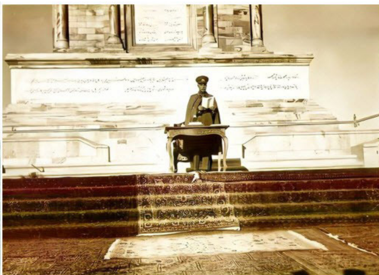
تصویر ۵. حضور رضاشاه در مراسم افتتاح مقبره فردوسی و بازنمایی مظاهر و نمادهای ایران باستان در اسکناس‌ها.