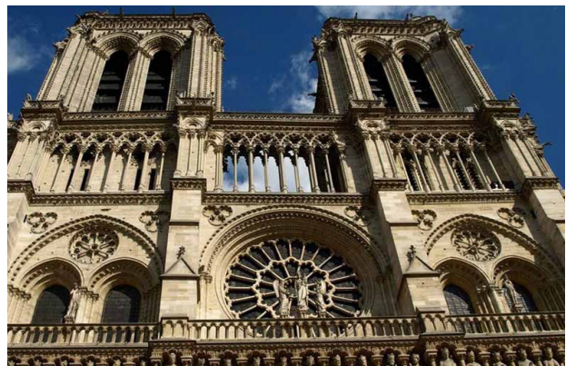
تصویر ۱. پیوند هنر با امر اجتماعی و خصلت شکل‌دهی و بازتابی آن در جامعه‌شناسی هنر.

می‌انجامید. اگرچه نمی‌توان دو ویژگی بازتاب و شکل‌دهی هنر را - در جهان هنر معاصر و با رواج دیدگاه‌های پساساختارگرایانه یا نگرش‌هایی همچون «هنر برای هنر» - به صورت کارکردهایی قطعی و مطلق، تنها امکان‌های پیش روی تحلیل اثر هنری در نظر گرفت، کماکان می‌توان در غالب موارد، بخشی از فرهنگ و روح حاکم بر فضای