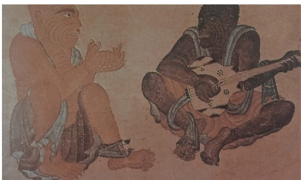
تصویر ۴. محمد سیاه قلم، هرات. مأخذ: همان، ۱۴۹.