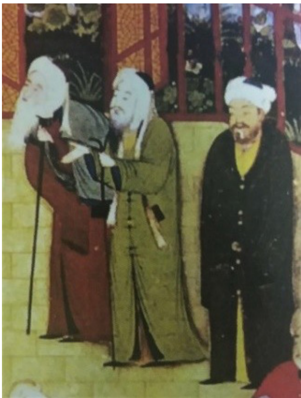
تصویر ۷. بخشی از اثر، کمال‌الدین بهزاد، هرات. مأخذ: آژند، ۱۳۹۲، ۳۱۴.