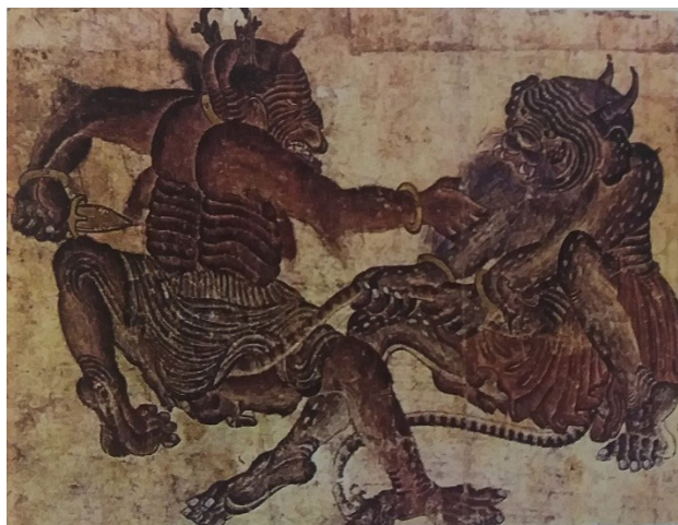
تصویر ۱. محمد سیاه قلم، هرات.

همگان قرار نگرفته است، اما همگان بر آن اند که این آثار کار یک نفر هنرمند مسلمان است (همان). همچنین این آثار در عین شباهتی که به نقاشی چینی دارند، چینی نیستند. به عنوان مثال در نگارگری ایران نشان دادن دندانها کمتر ممکن است به چشم بخورد، در حالی که در آثار «محمد سیاه قلم» این مورد دیده می شود، که شاید از نقاشی چینی