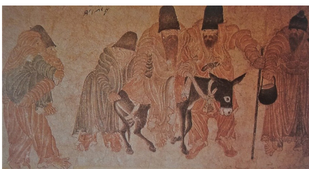
تصویر ۶. محمد سیاه قلم، هرات.

– تکرار: از عناصر اساسی در نگارگری ایران می‌توان به خط