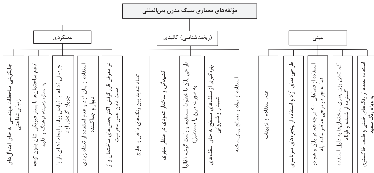
تصویر ۳. مؤلفه‌های سبک مدرن بین‌المللی در سطوح مختلف.

از سبک مدرن بین‌المللی از نظر ابعاد عینی، عملکردی و کالبدی تقریباً مشابه بوده‌اند با این تفاوت که در ازبکستان در فاصله سال‌های ۱۹۷۱-۱۹۸۳ م. به موازات انطباق ساختمان‌های مسکونی با شرایط جغرافیایی، اقلیمی و تاریخی و جست‌وجو برای سبک ملی‌گرایانه در محوریت کار دولت قرار می‌گیرند. تزئینات معماری و طرح‌های هندسی دوران اسلامی به عنوان عناصر جدایی‌ناپذیر در فرآیند انبوه‌سازی مورد استقبال دولت و ملت و به کارگیری تزئینات دوران اسلامی در نما، به‌طور رسمی در حیطه کار نظام شوروی قرار می‌گیرد.