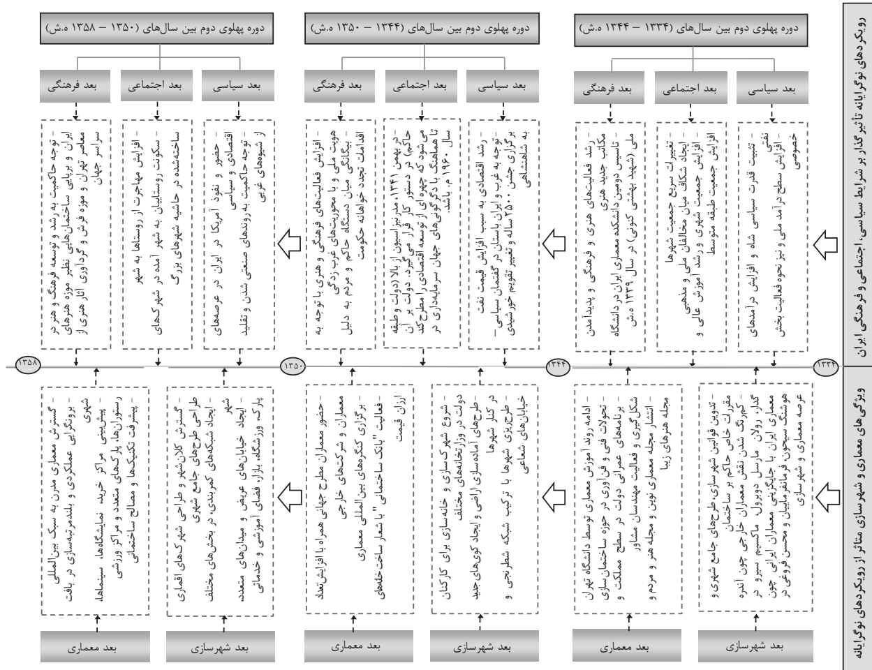
تصویر ۱. رویکردهای نوگرایانه تأثیرگذار بر شکل‌گیری معماری مدرن سبک بین‌المللی در سال‌های ۱۳۳۴-۱۳۵۷ ه.ش. در ایران.