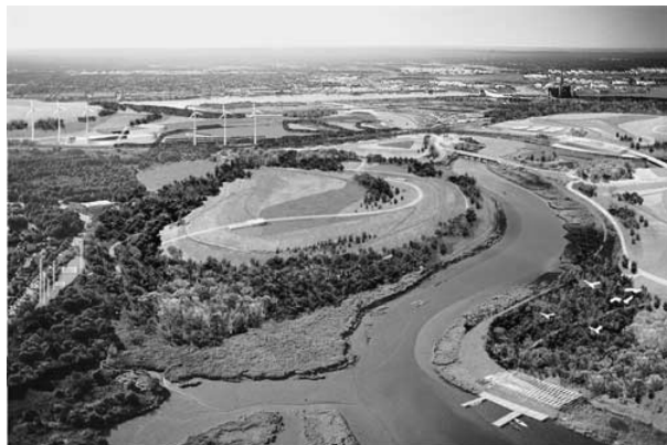
تصویر ۳. پارک فرش کیلز، نیویورک، لایه های پوشش گیاهی، زیست جانوری و انسانی در موازنه با نظام اکولوژیکی اثر جیمز کرنر و استان آلن، ۱۹۹۷

اکولوژیکی در نظر گرفتند، همگی بر مبنای الگوی پیشنهادی مک هارگ در کتاب «طراحی به کمک طبیعت» قابل توضیح است. این پارک را شاید بتوان اولین پروژه با مقیاس بزرگ در حوزه شهرسازی منظر پس از پروژه های داونس ویو و دولویل نام برد. در حقیقت طرح تهیه شده به مثابه یک طرح جامع سه بعدی (Master Plan) انواع لایه های پوشش گیاهی، زیست جانوری و انسانی را مدنظر قرار داده است.