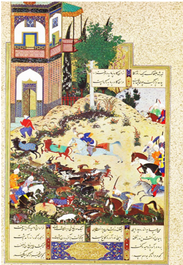
تصویر ۳. شاهنامه تهماسبی، ضحاک گاو برمایه را می کشد. سده شانزده/ده.