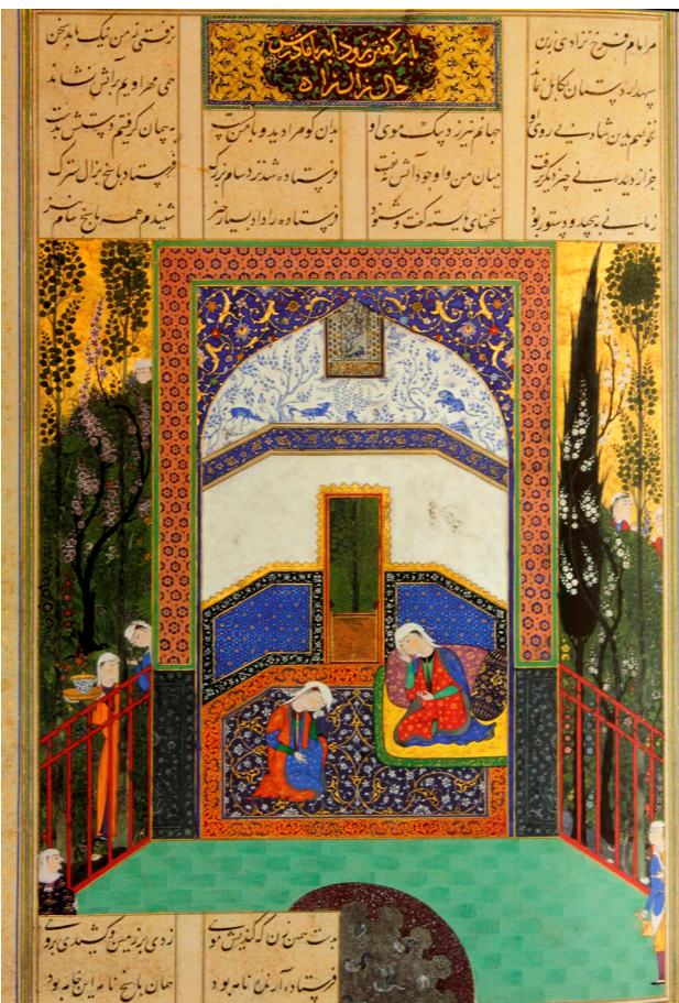
تصویر ۷. همان، آگاهی یافتن سیندخت از حال دخترش رودابه، سده شانزدهم.

نگ داشتن چنین فرزندی را بر نمی تافت فرمان داد تا او را برداشتند و از آن بوم به البرزکوه بردند و بر ستیغ آن کوه نزدیک خانه سیمرغ بنهادند و بازگشتند (رستگار فسایی، ۱۳۸۸: ۴۸۵). طرد کردن زال توسط سام و سرگردان شدن او نیز می تواند ارتباط نمادین زال با درخت سرو باشد. نیز نام زال به معنای "نزار و ناتوان از پیروی" است (کزازی، ۱۳۸۶: ۳۹۳). لفظ پیر شکلی از "پئیریک" است که به معنای روح درخت و چشمه هاست (بهار، ۱۳۷۶: ۲۶۱) که دلیل دیگر برای ارتباط زال با درخت می تواند باشد.