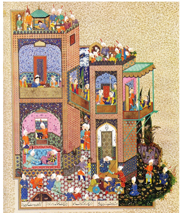
تصویر ۱. شاهنامه تهماسبی، ضحاک خواب خود را برای همسرانش بازگو می کند. سده شانزده/ده.