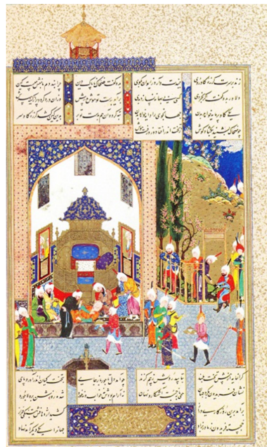
تصویر ۲. شاهنامه تهماسبی، تعبیر کردن خواب ضحاک. سده شانزده/ده.