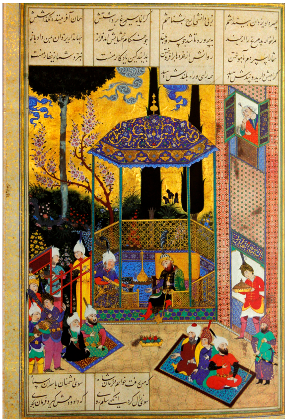
تصویر ۵. همان، تولد زال، سده شانزدهم.