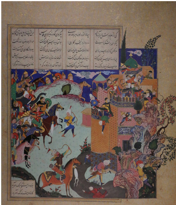
تصویر ۸. همان، رستم قلعه بیداد را خراب می کند، سده شانزدهم.