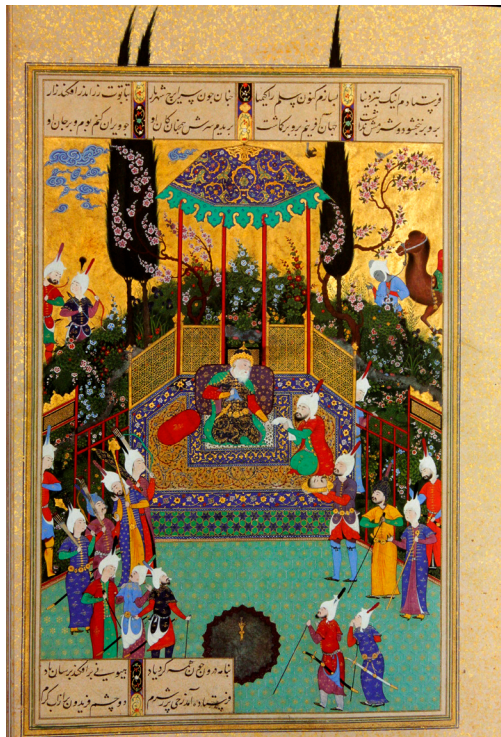
تصویر ۴. شاهنامه تهماسبی، فریدون سر تور را دریافت می کند. سده شانزده/ده.