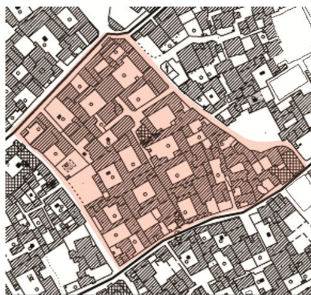
تصویر ۶. نقشه موقعیت گره محله‌ای در بافت تاریخی جویباره شهر اصفهان.