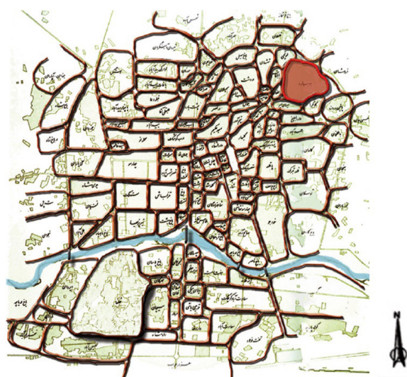
Joobareh Limit Old Locals Limits