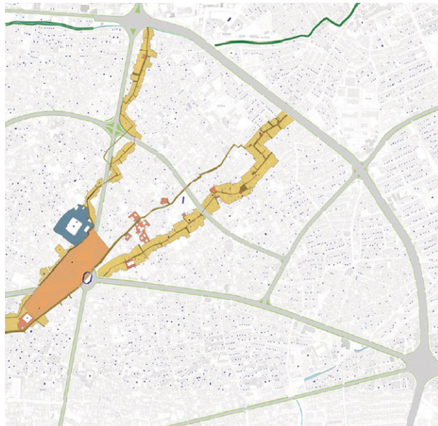
تصویر ۳. میدان کهنه و محور تاریخی جویباره.

حلقه گمشده شهر است بار دیگر به شهر پیوند زند (تصویر ۳).