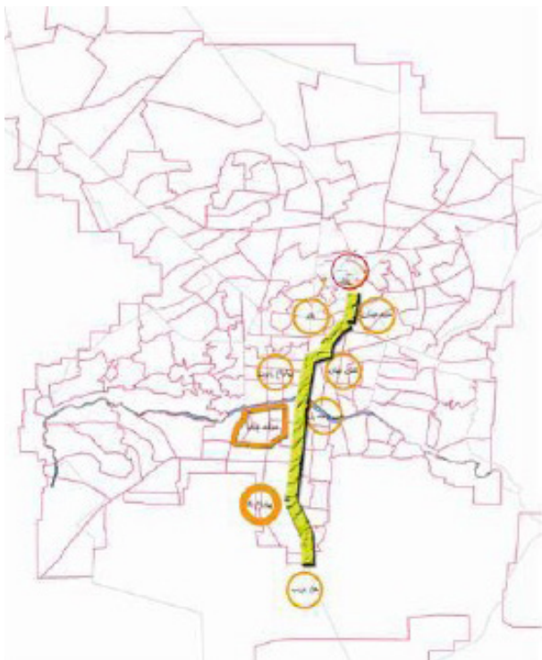
تصویر ۴. هفت محور مورد شناسایی‌شده در شهر اصفهان.

در خصوص سامان‌بخشی محله جویباره، سازمان‌های ذی‌ربط اقدام به سنگ‌فرش کردن برخی از کوچه‌های جویباره و بدنه‌سازی، مرمت دیوار خانه‌ها، بهسازی فضای مناره‌ها و مرمت آنها، تعریض برخی کوچه‌ها و ایجاد پارک و فضای سبز و نوسازی حسینییه و مراکز مذهبی، از جمله کارهای انجام‌شده در محله جویباره است. عدم