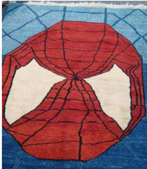
تصویر ۱. نقاب مرد عنکبوتی در قالی تبریز.

مطالعات میدانی و انجام مصاحبه با تولیدکنندگان و طراحان قالی تبریز در جهت تبیین چرایی توسل به محتوای غربی در نقش‌اندازی قالی‌های تبریز نشان داد که عمده این افراد با این اظهار نظر یکی از طراحان مطرح قالی تبریز که عقیده دارد «فرش کالای تجاری است و اصالت و کلاسیک بودن غلط است» موافق هستند. اینان عقیده دارند که «خواستۀ بازار و مشتری مهم است و باید تابع نظر مشتری باشیم». چنین نگرشی، رویکرد در حال گسترش در نظام طراحی و تولید قالی تبریز است. از این رو همان‌طور که «اسپونر» عقیده دارد: «بافنده یا طراح امروزی دیگر شیوه گذشتگان را در به‌کارگیری و تکرار موتیف‌های سنتی برای هرچه شبیه‌تر بودن به نمونه‌های قبلی