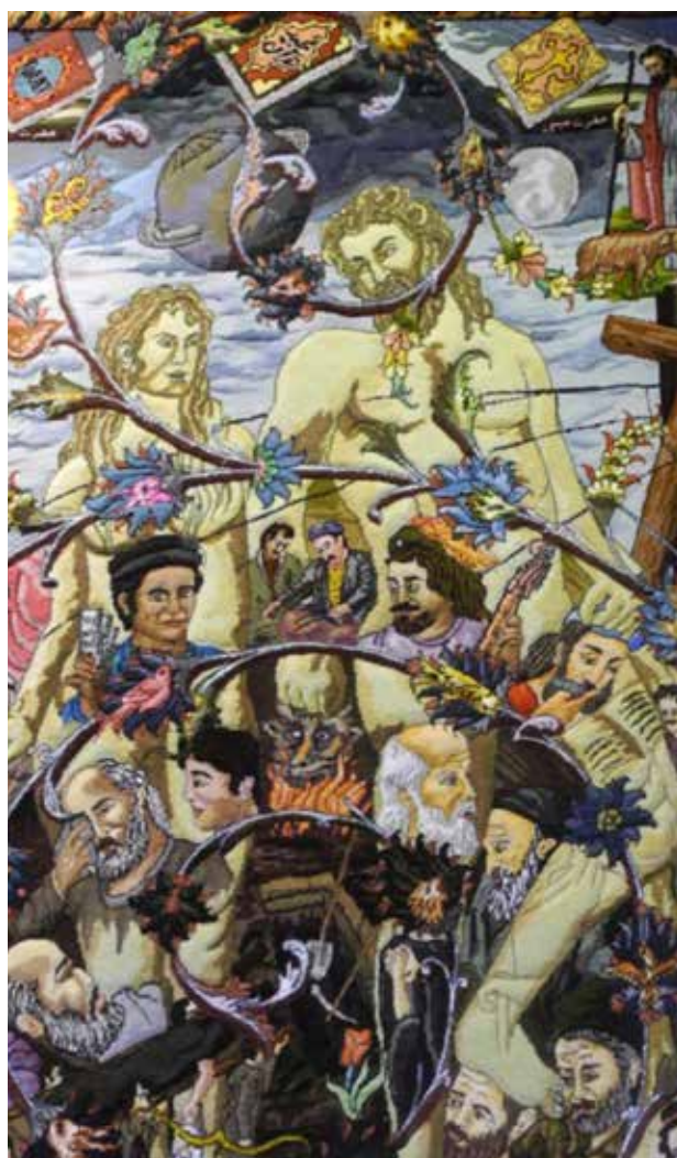
تصویر ۳. بخشی از قالی با عنوان گردش خلقت.

«بدون قابلیت دانش‌اندوزی عاملان، ساختارها و نهادها وجود نخواهند داشت. زیرا معرفت اصل اساسی بازتولید اجتماعی است» (پیرسون، ۱۳۸۴: ۱۴۶). لذا مطالعه کیفیت نظام آموزش هنرمندان طراح و تأثیر آن در نظام طراحی قالی تبریز اهمیت می‌یابد. از منظر جامعه‌شناسی منظور از آموزش، انتقال دانش، مهارت و شیوه کنش‌های متقابل در موقعیت‌های مختلف است تا از این طریق اعضای جدید با چهارچوب‌های جامعه خود آشنا شوند. «جامعه‌شناسان بین آموزش به معنای عام و