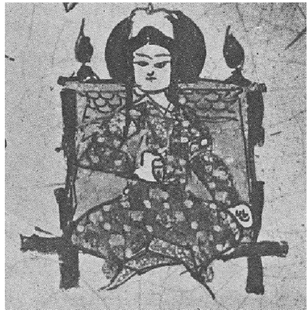
تصویر ۲. تخت سلجوقی، کاسه مینیایی، ری.

می‌کند، می‌گیرد" (رید، ۱۳۷۱:۲۲۳) و هر آنچه ما انجام می‌دهیم در درون ساختارهای اجتماعی صورت می‌گیرد، بنابراین از آنها تأثیر می‌پذیریم (رامین، ۱۳۸۹:۱۷) از این رو این نکته را می‌بایست مورد توجه قرار داد که هنرمند-مبل‌ساز عصر سلجوقی در دوره‌ای می‌زیسته که از یک سو وارث الگوهای ساختاری و تزئینی مبلمان ایرانی پیش از سلجوقی بوده و از سوی دیگر می‌بایست پاسخگوی نیازهای کاربردی و رفتاری کاربران (حاکمان سلجوقی) باشد.