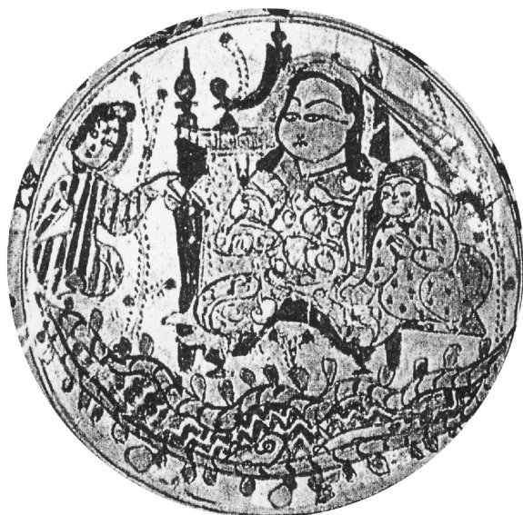
تصویر ۵. نشستگاه تاجدار