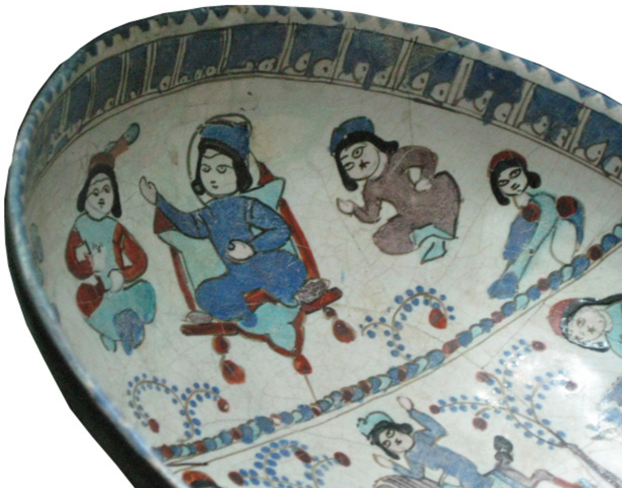
تصویر ۱. تخت سلجوقی منقوش بر کاسه مینایی.

اما نکته قابل توجه علاوه بر اشکال، غنای شگفت‌انگیز طرح‌های تزئینی و نقشمایه‌های پیکره‌ای آن است. چنین می‌نماید که شکوفایی و کاربرد تصویر پیکره‌ای و نمادین در تخالف با گرایش تصویری عمومی جهان اسلام باشد که تبیین بیشتری را می‌طلبد. از آنجا که ایران در این دوران کانون و رهبر هنر به شمار می‌رفت و نیز بخش اعظم مجموعه پیکره‌ای این عهد در ارتباط با ایران بود، برای حل معما لازم است به دو نوشته فارسی و مخصوصاً به دو جنبه از آن رجوع کنیم. خمسه نظامی حاوی تصاویر رنگی درخشانی به شکل استعاره است. این نوع تصاویر بالاتر از همه محصول یک بینش عاطفی و احساسی است که به گونه تخیل جلوه یافته و هویت وجودی ویژه‌ای پیدا کرده است. در اشعار عرفانی مثنوی مولانا، برای نخستین بار بازنمایی‌های پیکره‌ای جلوه‌گر شده و هدف از آن نیز رد و تکذیب نقاشی از دیدگاه مذهبی نیست بلکه بهره‌گیری تعلیمی از آن برای تبیین رموز باریتعالی