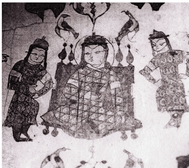
تصویر ۳. نشستگاه سلجوقی، کاسه مینیایی.