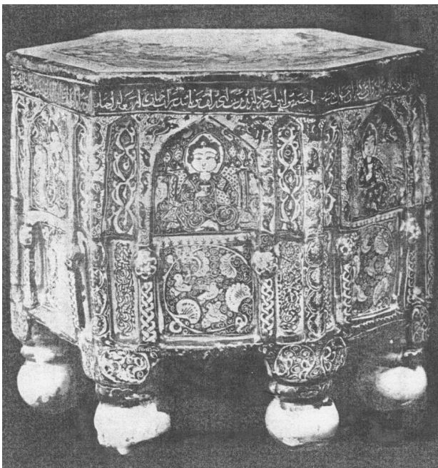
تصویر ۸. چهارپایه از کاشی منقش مینایی