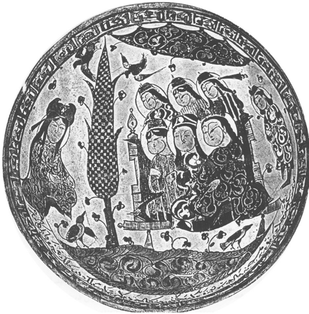
تصویر ۷. نشستگاه چندنفره مأخذ: Pope, VOL10, 1971: 687