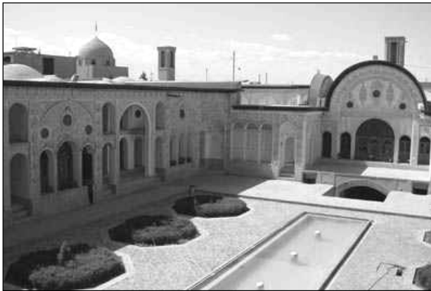
تصویر ۳: تشدید اهمیت مرکزگرایی در معماری سنتی ایران با قرار دادن عنصر ارزشمند آب

وجود حوض در مرکز حیاط، اشاره بر اهمیت و مرکزیت آب در هستی دارد. حیاط مظهري از صورت مرکزگرای عالم صغیر یا باطن است. فضا در حد مکان "کنز مخفی" خانه در شکل محاط شده است، همچنان که در انسان نیز نفس که دربرگیرنده روح است، در جسم محاط می شود. میانکش شکل و سطح باید فضایی پاک، غرق آرامش و خالی از هر تنش و تفکر انگیز باشد. تعبیه حوض سنتی در این فضای آرام، مرکزی را همچون جهتی مثبت برای تخیل خلاقه فراهم می آورد. بدینسان آفرینش عرضی آدمی به علت طولیه می پیوندد و بازسازی بهشت تمامی می پذیرد. (اردلان و بختیار، ۱۳۸۰: ۶۸) تصور بهشت موعود که از ادوار قبل تا کنون در مخیله ایرانیان به وجود آمده، تصویری است از زیباترین و دلپذیرترین باغ ها. (ویلبر، ۱۳۴۸: ۵۲) حیاط ها نماد و تمثیلی از بهشت هستند که در خانه های ایرانی، جلوه خاص خود را داشته اند. به تعبیر بورکهارت، طبیعت بهشت ایجاب می کند که مستور و راز آلود باشد؛ به همین ترتیب خانه مسلمان با حیاط مرکزی محصور شده به همراه درختان و آب، مشابه این جهان معنوی است. (نقی زاده، ۱۳۴۸: ۲۲۲) همچنین آیات بسیاری در قرآن به کرات آب را به عنوان یکی از عناصر بهشت معرفی می نماید. ۴