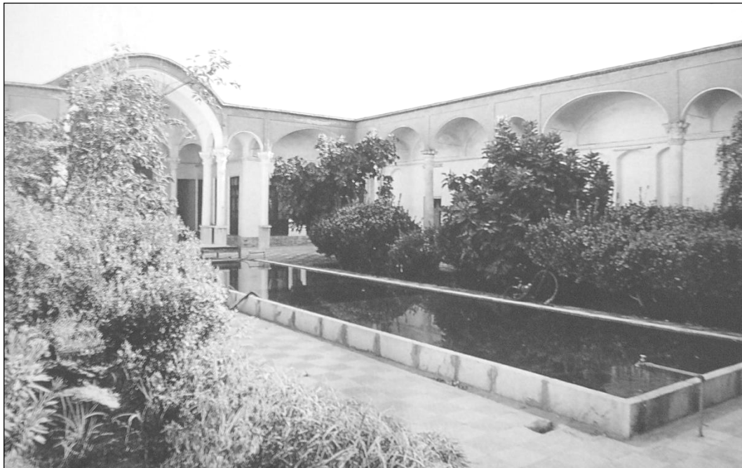
تصویر ۱: جایگاه استقرار حوض آب در حیاط خانه سنتی ایران

هر بنایی به عنوانی جزئی از فرهنگ، وظیفه دارد که یک اندیشه ذهنی را از طریق فرم، عینیت بخشد و این عینیت حامل پیامی تحت عنوان "هویت" مطرح می شود. معمار سنتی در جستجوی نظمی بر اساس بهره وری از مواهب طبیعی و هماهنگی با نظم حاکم بر طبیعت بوده؛ به دنبال آماده سازی مکانی است که هر آنچه از مواهب طبیعی است، در محدوده زیست فراهم آورد؛ بدون آنکه خلوت زندگی به هم بخورد. در پاسخ به این خواست، خصوصی ترین باغ درونی را می سازد و آن را با نام حیاط معرفی می کند. حالت بلورین و طرح منظم هندسی فضاها در خانه سنتی و ساختار هندسی این واحدهای بلورین برگرد حیاط، بر اساس ملاحظات محیط زیست و رعایت عرصه های عمومی تا خصوصی است که کل خانه را می سازد.