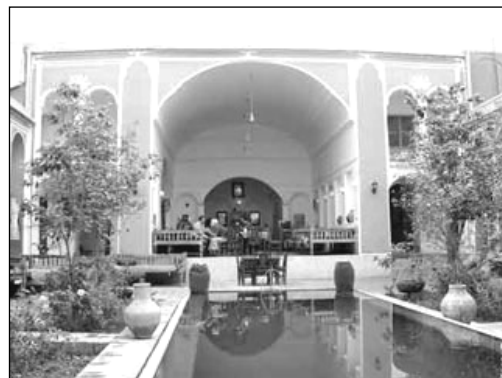
تصویر ۴: تدوین فضای قرار در حیاط خانه سنتی با استفاده از عنصر آب

در اسلام آب زمینه ساز ارتباط با معبود بوده و شرط دخول در بسیاری از عبادات، وضو داشتن است. انجام آیین وضو، به معنای یکی دانستن خود، در دنیای مادی، با موج رحمت خدا و بازگشت به همراه آن به سوی اصل و مبدأ است. (لینگز، ۱۳۷۴: ۶۰۵). حضور آب در حوض حیاط های خانه سنتی، فرصت مناسبی را جهت انجام مقدمات فرائض دینی فراهم می آورد.