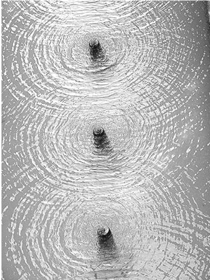
تصویر ۶: منظر، ترنم، خنکی و احساس با بهره گیری از عنصر آب در حیاط خانه سنتی ایرانی

از سر و کول هم بالا می روند (نایی، ۱۳۸۱: ۹) و چنانکه در کتاب حس وحدت می خوانیم: "افاضه فواره- زاینده ی دواير آب با شعاع های دم افزون- آغازگر دوباره ی تناوب بسط و قبضی آگاهانه است." (اردلان و بختیار، ۱۳۸۰: ۶۸)