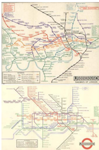
تصویر ۴. تصویر بالا نقشه متروی لندن براساس واقعیت خطوط مترو. تصویر پایین بازنمایی گرافیکی آن به منظور ادراک بهتر. هدف: مسیریابی آسان.

واقعی یا گرافیکی از فرآیند شکل‌گیری یک موضوع یا یک روش آموزشی است. (تصویر ۵) جزوه‌ها، کتب، لوح‌های آموزشی و بازنمایی‌های روایت‌گونه دنباله‌دار نیز در این بخش تقسیم‌بندی می‌شود. هدف این بازنمایی ادراک بهتر جزئیات یک خبر، حادثه، رویداد یا داستان است. بازنمایی روایی دربرگیرنده تصاویری است که معمولاً یک خط آغاز و پایان دارد. این گونه تصاویر ممکن است بازنمایی یک خبر، حادثه یا سلسله مراتب وقوع یک حادثه باشد که به جهت ادراک با چند گام تصویری بیان می‌شود. تصویرسازی‌های کودکان که داستان‌های آموزشی و اخلاقی را بازآفرینی می‌کنند در این دسته قرار می‌گیرند.