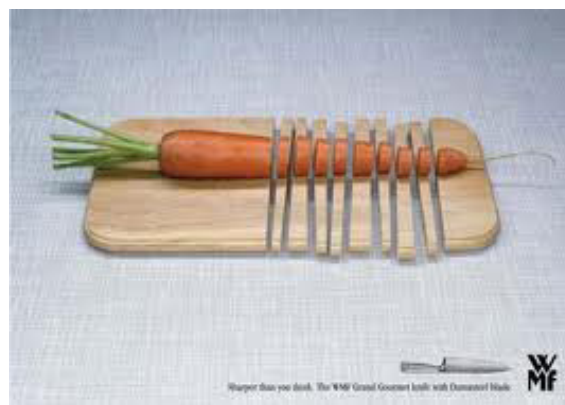
تصویر ۶. تبلیغ یک کارد آشپزخانه که باز بازنمایی تصویری و اغراق در برش چوب زبردست قدرت برش کارد را نشان می دهد. هدف: عرضه و تبلیغات ارتباط سریع.

می‌بایند، بروز بازنمایی در یک اثر گرافیک ممکن است کارکردی چندگانه داشته باشد. برای مثال یک اثر بازنمایی ضمن اینکه اطلاع‌رسان است ممکن است هویت‌نما و تبلیغاتی هم باشد؛ بنابر برخی از دستاوردهای این مقاله که به گمان در قیاس با پیشینه فراتر از آن است بدین شرح بیان می‌شود: بعضی از بازنمایی‌ها فاقد مابه‌ازاء خارجی هستند، مانند نشانه‌ای که از یک شکل انتزاعی طراحی می‌شود. همه بازنمایی در گرافیک معطوف به گذشته نیست، گاه آثار گرافیک بازنمایی آینده هستند (مانند تصاویر فناوری‌های نوین) بازنمایی‌هایی خلاقانه در راستای ذات گرافیک را می‌توان بازآفرینی نامید. برخی از شاخه‌های گرافیک چون نشانه به علت ضابطه‌مند بودن قابل تغییر و دخل و تصرف نیستند بنابراین بازنمایی در این‌گونه موارد نعل به نعل است. مانند نشانه‌های سازمان‌ها شرکت‌ها و نشانه‌ها و علائم رسمی دولت‌ها. نمودار ۱ چگونگی بهره‌گیری از مطالب پیشینه بحث و دستاوردها را نشان می‌دهد.