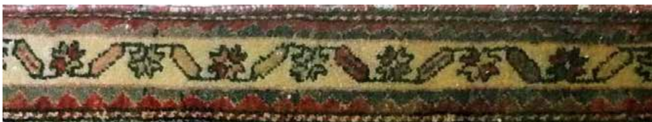
تصویر ۳۷. حاشیه بلوجیک، جزئی از تصویر ۱۸ (بافت روستای چوزه). مأخذ: آرشیو نگارندگان.