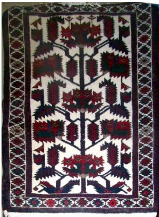
تصویر ۲. قالی نقشه‌ارمنی، نقشهٔ بوته‌خاری (بافت شاهسون‌های خرقان).

رو، قالی نقشه‌ارمنی با طرح اقتباسی در نوع نقوش به‌کاررفته از نمونه‌های مشابه بازشناخته می‌شود. این نقشه‌ها گاه از مناطق و اقوام هم‌جوار متأثرند و گاه از دیگر بافته‌ها و نقوش خاص ارمنی الهام گرفته شده‌اند. آنچه سبب تمایز و شناخت این نقشه‌ها از موارد مشابه در میان اقوام هم‌جوار می‌شود تأثیر ویژگی‌های فرهنگ ارمنی بر قالی‌های ارمنی‌باف است. در ادامه، نقوش قالی‌های نقشه‌ارمنی در سه بخش کلی متن، حاشیهٔ بزرگ و حاشیهٔ کوچک بررسی می‌شوند.