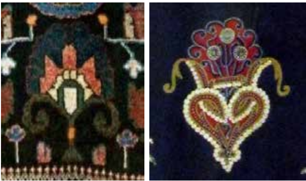
تصویر ۲۲ (راست). نقش گلدان بر پارچه تزیینی ارمنی، کلیسای مریم مقدس تهران. مأخذ: آرشیو نگارندگان. تصویر ۲۳ (چپ). نقش گلدان در قالی ارمنی، جزئی از تصویر ۱۸. مأخذ: آرشیو نگارندگان.