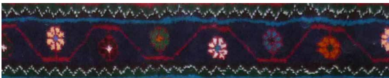
تصویر ۳۶. حاشیه بلوجیک (بافت روستای لار).