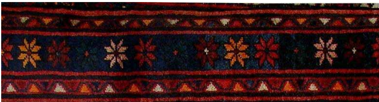
تصویر ۲۹. حاشیه آستخ در قالی ارمنی، جزئی از تصویر ۹.