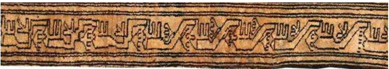
تصویر ۳۹. حاشیه شانه‌بسر (بافت منطقه آبگرم).