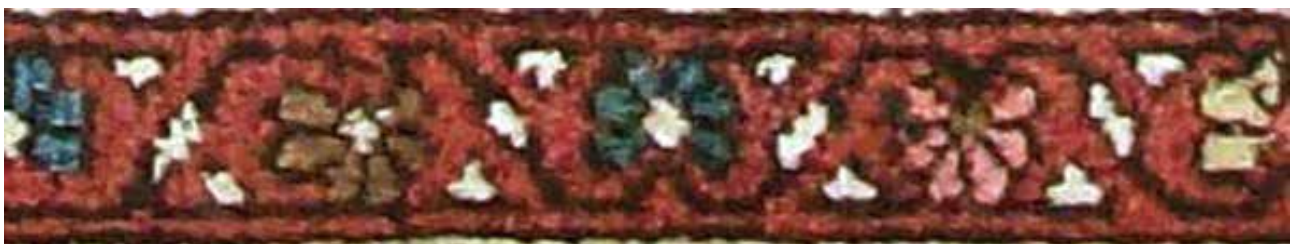
تصویر ۴۲. حاشیه بلوجیک (بافت خرقان).