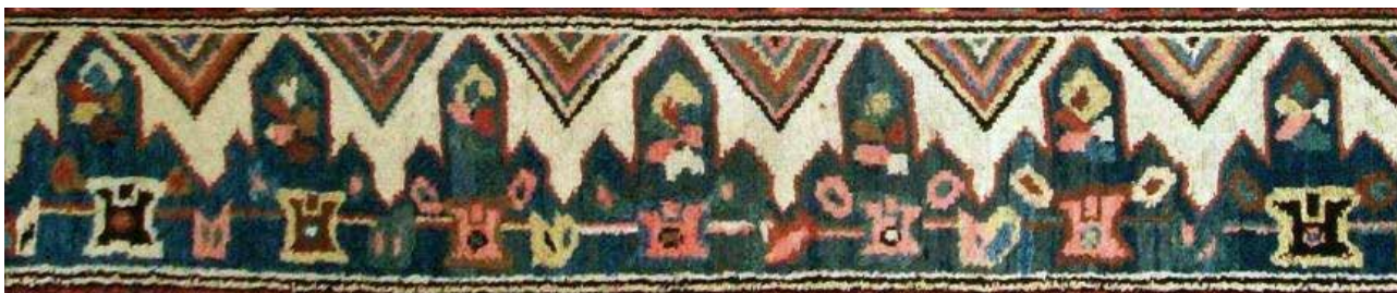
تصویر ۲۵. حاشیه کلیسا (چاناخچی) در قالی ارمنی، جزئی از تصویر ۸.