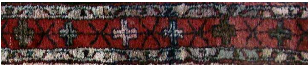
تصویر ۲۸. حاشیه چلیپا در قالی ارمنی.