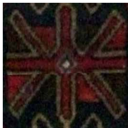
تصویر ۳۰ (راست). چلیپا با تکرار بازوها، جزئی از تصویر ۱۵. مأخذ: آرشیو نگارندگان. تصویر ۳۱ (وسط). نقش آستخ در قالی بافت پنبک. مأخذ: آرشیو نگارندگان. تصویر ۳۲ (چپ). نقش ستاره بشارت گر بر روی کفش زنانه ارمنی، کلیسای مریم مقدس تهران. مأخذ: آرشیو نگارندگان.