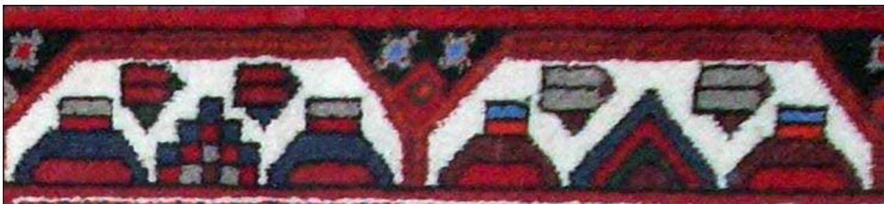
تصویر ۲۶. حاشیه یورت در قالی شاهسون، خرقان. مأخذ: آرشیو نگارندگان.