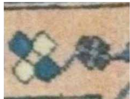
تصویر ۱۳ (راست بالا). نقش گل چهارپیر و هشت پر در قالی های نقشه‌ارمنی خرقان. مأخذ: آرشیو نگارندگان. تصویر ۱۴ (راست پایین). نقش استخ (ستاره) در قالی های نقشه‌ارمنی خرقان. مأخذ: آرشیو نگارندگان. تصویر ۱۵ (وسط). نقشه ترنج چلیپا (بافت روستای توآباد). مأخذ: آرشیو نگارندگان. تصویر ۱۶ (چپ). نقشه ترنج چلیپا (بافت روستای توآباد). مأخذ: آرشیو نگارندگان.