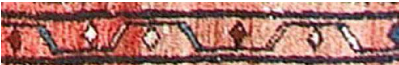
تصویر ۴۳. حاشیه بلوجیک (بافت روستای لار).