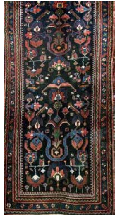
تصویر ۱۸. نقشه گلدانی (بافت روستای چوزه). مأخذ: آرشیو نگارندگان. تصویر ۱۹. نقشه گلدانی (بافت روستای چوزه). مأخذ: آرشیو نگارندگان. تصویر ۲۰. نقشه گلدانی (بافت روستای چوزه). مأخذ: آرشیو نگارندگان.