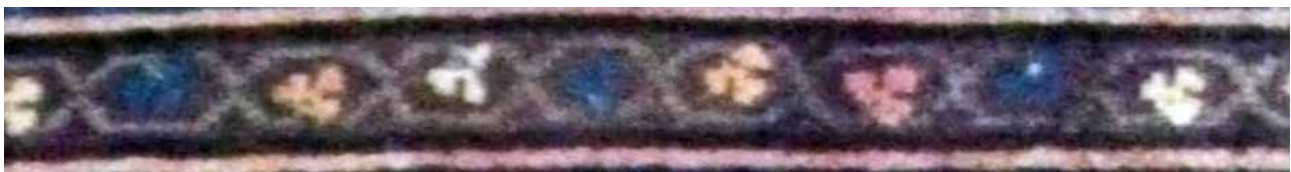
تصویر ۴۴. حاشیه بلوجیک قرینه (بافت روستای آلاچان).