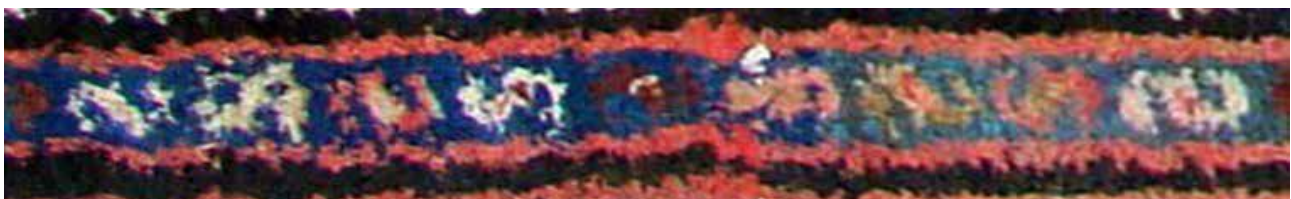
تصویر ۴۶. حاشیه S.