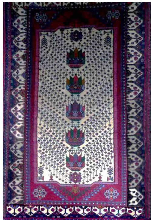
تصویر ۵ (راست). نقشه کاسه‌بشقابی و گیلای (بافت روستای چناقچی).