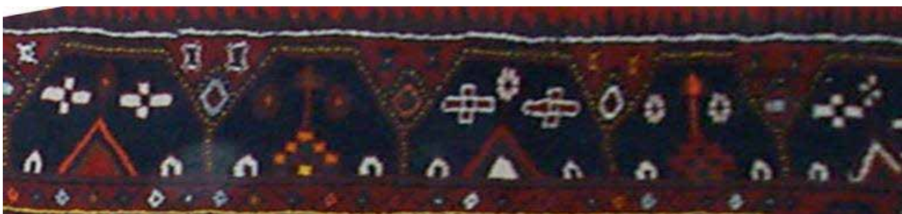
تصویر ۲۷. حاشیه کلیسا در قالی ارمنی، جزئی از تصویر ۶، خرقان.