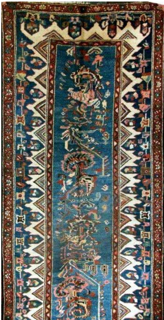
تصویر ۹. نقشه افشان گل‌بتویی (بافت روستای چوزه)، از مجموعه مهدی کبیری.