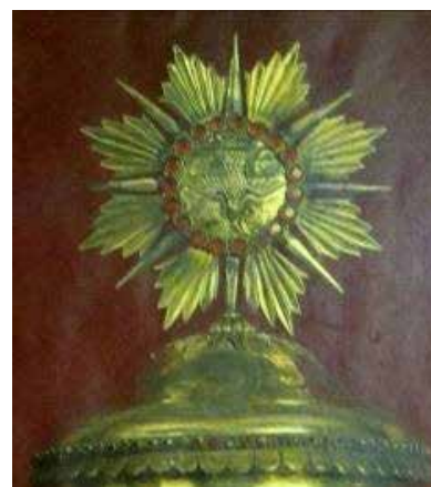
تصویر ۳۳ (راست). نقش ستاره بشارت گر بر ظرف ارمنی، کلیسای مریم مقدس تهران. مأخذ: آرشیو نگارندگان. تصویر ۳۴ (وسط). چلیپا با تکرار بازوها، کلیسای مریم مقدس تهران. مأخذ: آرشیو نگارندگان. تصویر ۳۵ (چپ). نقش آستخ بر کلاه اسقف ارمنی، کلیسای مریم مقدس تهران. مأخذ: آرشیو نگارندگان.