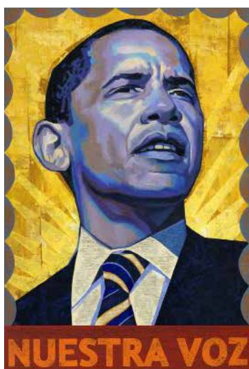
تصویر ۴. رافائل لوپز، تلفیق تصویر کاندیدای ریاست جمهوری با عناصر انقلابی از امریکای جنوبی.

کاندیدا در حالی که در مرکز تصویر قرار گرفته، تمامی کادر را اشغال کرده و نگاهی با شیب تند و مصمم به دور دست دارد، اشعه‌های آفتاب در پشت سر و اندک اخم روی پیشانی که حاکی از عزم راسخ است به این تصویر آیکونوگرافی انقلابی می‌بخشد. تضاد میان رنگ آبی و زرد از سویی و قاب بسته دور کادر و