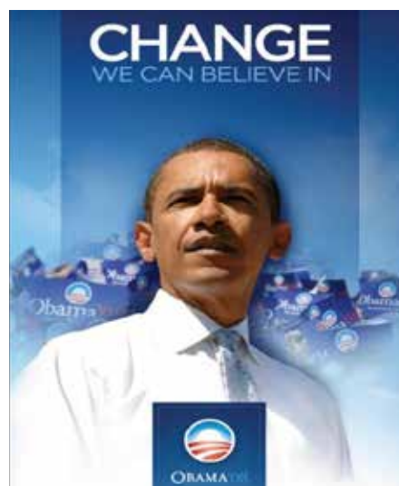
تصویر ۲. نمونه‌ای از پوستره‌های تبلیغاتی کاندیدای ریاست جمهوری Obama (2008). Change We Can Believe In for America '08.